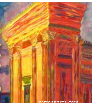
ציור: יהושע ויסמן