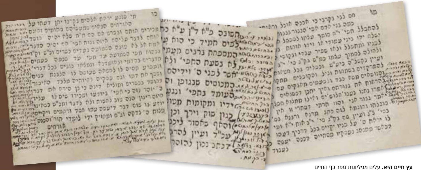
עץ חיים היא. עלים מגיליונות ספר כף החיים ועליהם הגהותיו של אדמו"ר הרשב"ב בכתב יד קדשו

יד קדשו (נדפסו בספר 'מבית הגגונים' פרק פו).