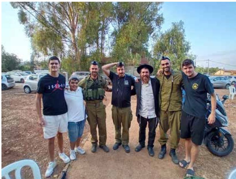
השליח לנוער עם נערים במבצע תפילין עם חיילים בקרית שמונה

במקביל - ח"ו - גם כאן בצפון. כך גם כשקיבלנו את ההנחיה שעלינו להתפנות מיידית - אלו היו רגעים של אי ודאות גדולה. לא ידענו מה יהיה בשעה הקרובה, כשהסכנה של השכנים מצפון לגבול ריחפה באוויר."