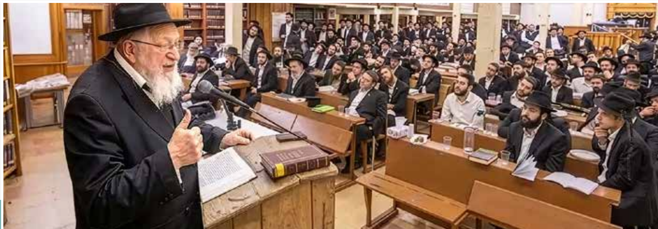
גיעת התורה. הרב פבנזר שליט"א בשיעור בבית המדרש 770 בברוקלין

נוספים בש"ס (ראה אוצר לקוטי שיחות - פרשת תשא, ב. לשיטתיהו - "ההווה לעומת העתיד"). זכורני כיצד צהבו פניו הקדושות של רבנו, והוא התבטא: "כדי לחזק עוד יותר את העניין, הקב"ה עוזר ומצינו מחלוקת נוספת בה הם הולכים בזה כל אחד לשיטתו...". לפתע, תוך כדי דיבור התרוממו ידיו מעל השולחן, והציבור כולו ראה כיצד רבנו מבאר את הדברים בליווי תנועות ידיים נלהבות... זו הייתה הפעם היחידה בה זכיתי לראות מחזה מפעים שכזה.