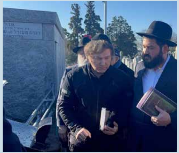
הערכה אמיתית. נשיא ארגנטינה, חבייאר מיליי, לאחר אחד מביקוריו בציון הק' של כ"ק אדמו"ר מליובאוויטש זי"ע

"אם בעבר צעיר יהודי בארגנטינה היה חושב פעמיים אם ללכת עם כיפה ברחוב או לדבר בגלוי על יהדות, כיום יש תחושה של ביטחון ציבורי וסקרנות חיובית. אנשים רואים נשיא של מדינת ענק עומד מול ציונו של הרבי וכולו התרגשות אמיתית - זה יוצר הד חיובי עצום. אנו תפילה אפוא שהנשיא יצליח במלאכתו לשיקומה הכלכלי של המדינה, דבר שבוודאי יביא לתוספת ברכה ליהודים וליהדות".