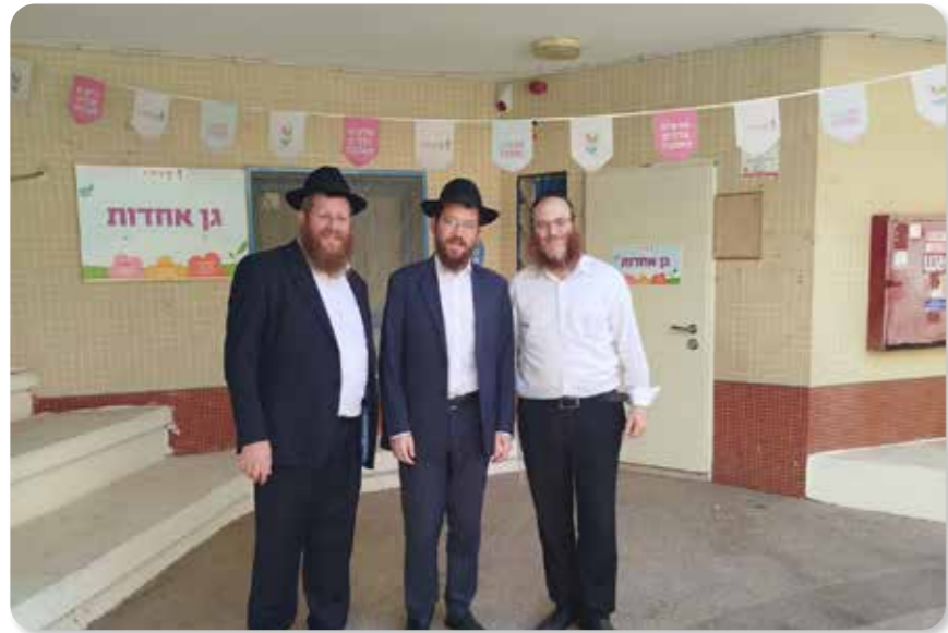
גן חב"ד החדש שנפתח השנה

שפרצה המלחמה היה רחוק מאוד מכל עניין יהודי ואף לא צם ביום הכיפורים, ה"י, כיום הוא ומשפחתו מבאי בית הכנסת הקבועים ומשתתפים בכל הפעילויות שלנו. אני חושב שהסיפור הזה הוא סיפור מייצג שיכול להסביר את התופעה המתרחשת בשנתיים האחרונות. התעוררות וצימאון אדיר."