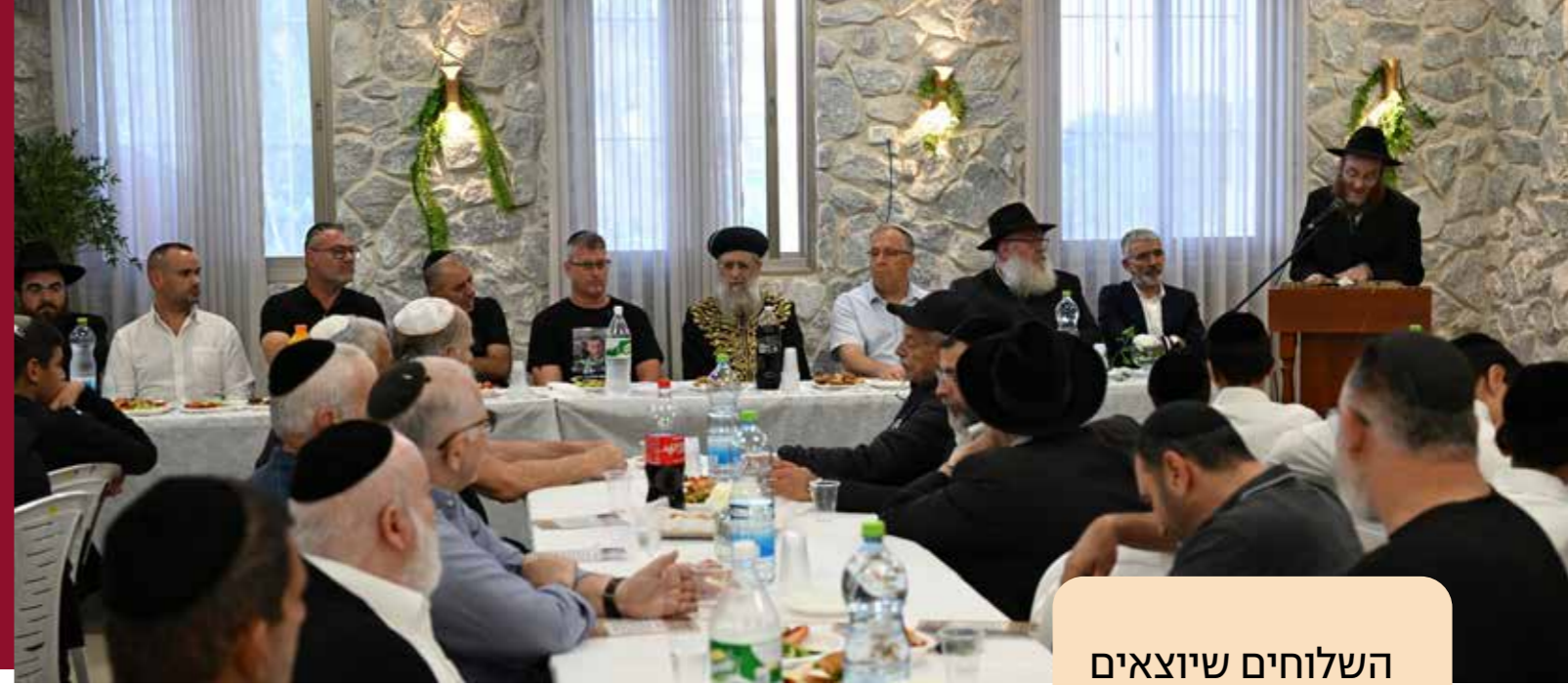
חנוכת האולם החדש של בית הכנסת, במעמד הרב הראשי לישראל, ראש העיר ונכבדי הקהילה

"לאחרונה מורגשת התעוררות גדולה מאוד בפרט אצל צעירים. התופעה הזו היא לא רק אצלי, אני שומע את זה משלוחים רבים. צעירים שמגיעים ומחפשים להיות בשיעור, מחפשים להשתתף בתפילה.