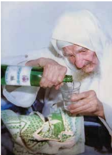
קדישא ופרישא. הבבא סאלי זצוק"ל

את שתי הבחינות הללו מוצאים אנו אצל רבי שמעון בר יוחאי: לאחר שנים עשרה השנים בהן שהה יחד עם בנו במערה, הם יצאו חזרה לעולם ובתחילה פשוט רצו לשרפו. לאחר תקופה כה ארוכה של חיי פרישות טהורים,