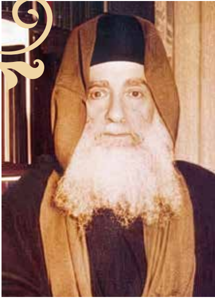
דעת אלוקים. הבבא מאיר זצוק"ל