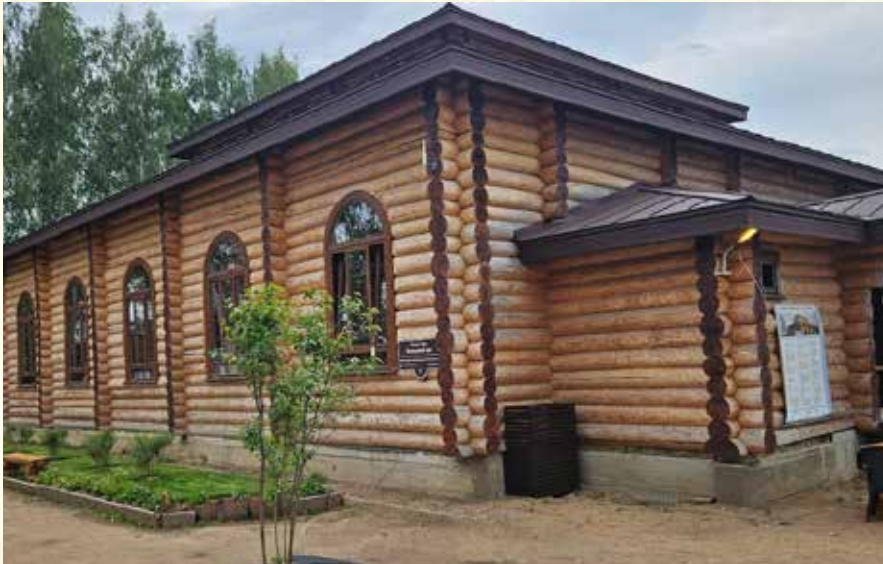
בית שמגדלין בו תורה. השחזור שנעשה בשנים האחרונות למבנה 'הזאל הגדול' - היכל בית המדרש בחצר רבותינו שנבנה בשעתו על פי הוראותיו של אדמו"ר מהר"ש ועמד על תילו יותר מיובל שנים, ושימש גם כמסעדה של ישיבת 'תומכי תמימים' המעטירה