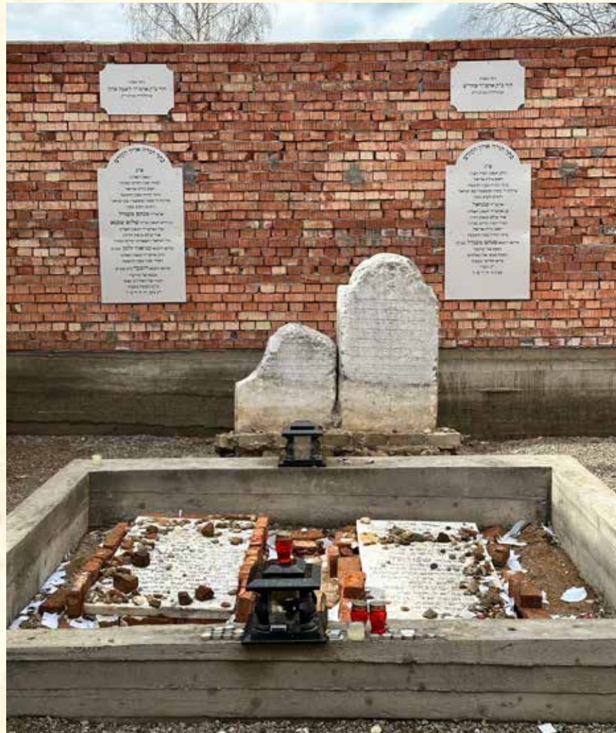
בחייהם ובמותם לא נפרדו. הציון הקדוש של אדמו"ר הצמח צדק ובנו אדמו"ר מהר"ש. המצבות המקוריות נראות מלפנים, ועל הקיר קבועות המצבות המשוחזרות