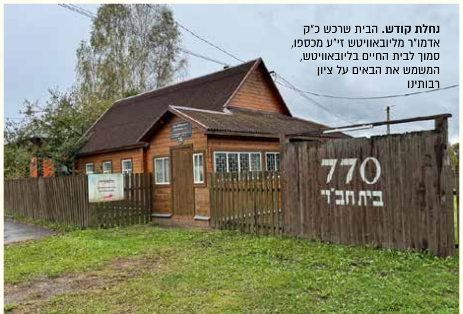
נחלת קודש. הבית שרכש כ"ק אדמו"ר מליובאוויטש ז"ע מכספו, סמוך לבית החיים בליובאוויטש, המשמש את הבאים על ציון רבותינו

בקרוב אבא למקום שבת כ"ק אדמו"ר, הגביה כ"ק אדמו"ר את עיניו מהספר ויבט בפני אבא ובפניו. אבא רעד בכל גופו, גם אני נבהלתי והתחלתי לבכות בלחישת, וכ"ק אדמו"ר הושיט ידו קדשו לקחת הפתקא אשר ביד אבא, כי מרוב חדרתו נשאר אבא לעמוד במקומו