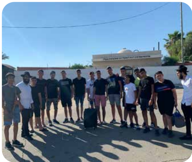
עושים כאן משהו שהוא הרבה מעבר לעוד פעילות לנוער. מה התוכניות להמשך?

"העיר נתיבות נמצאת כיום בתנופת התפתחות מסיבית", מספר הרב ידגר. "כשך המלחמה, המנופים חוזרים לעבוד והעיר מתרחבת, שכונות חדשות נבנות ומשפחות רבות מתווספות למצבת התושבים. זה גורם לנו לחשוב על הקמת סניף נוסף של חב"ד לנוער באזור אחר של העיר, על מנת שכל הנערים והנערות בנתיבות יכירו את הפעילות של חב"ד. במקביל, כמובן, אנחנו חושבים על התרחבות גם בהון האנושי. אם בתחילת השליחות הסתפקתי כמה הדבר ימלא לי את סדר היום, כעת אני מבין שאני צריך עוד כוח אדם שיעזור להרחיב את הפעילות.