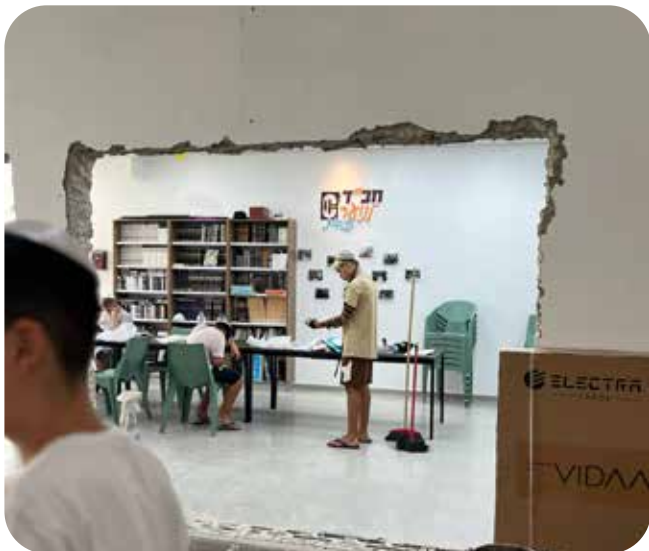
שיעורי התורה והפעילות המשיכו להתקיים ברצף במועדון המחודש גם במהלך תקופת השיפוץ