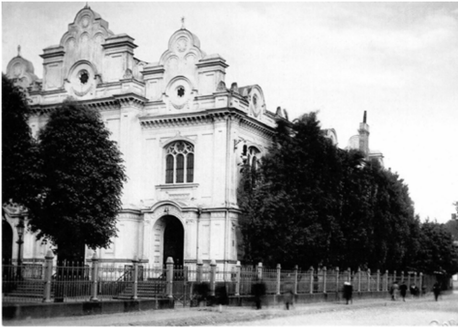
שאלו שרופה באש. בית הכנסת הגדול בריגה, בה שהה הגר"י בתקופה האחרונה לחייו, שנשרף בשנות השואה

תוכנו: אינני יודע במה זכיתי לכך, אבל עובדה היא שזכיתי להביא את החסידות למקומות שעד עתה היא מעולם לא הגיעה אליהם.