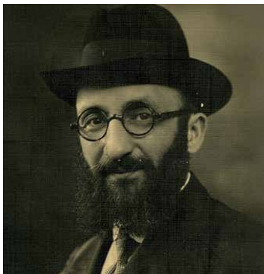
הימים שלמדתי עם הגר"י היו הימים המאושרים בחיי. הגרא"א דסלר זצ"ל