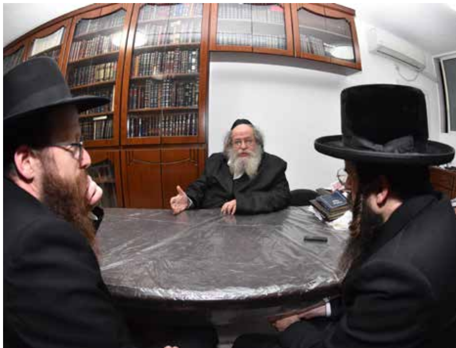
תורת החסידות חידשה שגם המחליף פרה בחמור זו עבודת ה', ואדרבה. הגרי"ד אלתר שליט"א בשיחתו ל'כי קרוב'

המתאים להתגלות ספר הזוהר. כך גם בכלל - הקב"ה הביא את העולם למצב כה חומרי בגלל כוונתו העליונה, וגילה את תורת החסידות כדי לקשר אליו כל יהודי גם במצבים אלו.