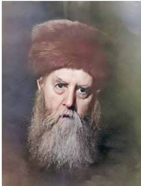
יש להאיר בתוך עצמנו את האמת עד שהזולת יימשך אליה. כ"ק אדמו"ר הר"צ מליובאוויטש ז"ע