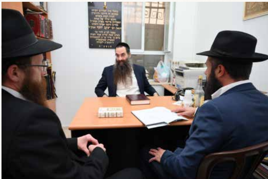
לחולל שינוי מן היסוד. הגר"ע יוסף שליט"א בנועם שיחו לכי קרוב'

ידוע שהבבא סאלי זי"ע הגיע לכאן עוד לפני קום המדינה, בשלהי המאה הקודמת. הוא