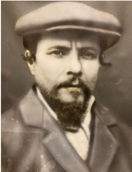
ר' חאניע באותן השנים

בחורף של שנה זו נדבק הרבי במחלת הטיפוס שהשתוללה באותו זמן, וכפי שתיאר ר' חאניע עצמו את המצב: באמצע חורף תר"פ התחילה ל"ע ולא עליכם מחלאות שונות ברחבי המדינה, "סיפנאיי טיף" (- טיפוס) "ברושטאיי" טיף, ועוד ועוד ר"ל, הקור והרעב התחזקו, פה ושם ידיעות שונות נוסף לזה חיי פחד ומגור מסביב מכל הבאנדעס השונות, אשר רובם ככולם עושים פרעות בישראל ירחם ה'.