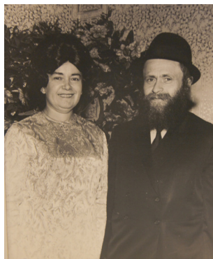
עם רעייתו תחי'