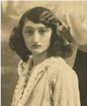
הרבנית שינא הי"ד

באחת הפעמים כשנכנסתי לחדר, הרבי ישב שם בפנינת החדר על כיסא פשוט, הרבי ששם לב לכניסתי, סימן לי להתקרב אליו, כשהתקרבתי שאלני הרבי: "היכן היצו הרע שלך?" סימנתי לו בצדו השמאלי של החזה, "והיכן יצר הטוב שלך?" הצבעתי על צד ימין, "והיכן הנשמה שלך?" הצבעתי על המצח, "ומה יש לך בתוך הנשמה?" הוסיף הרבי לשאול, אני, שלא ידעתי מה לענות, שתקתי, המשיך הרבי ואמר: "בתוך הנשמה יש לך עוד נשמלה קטנה".