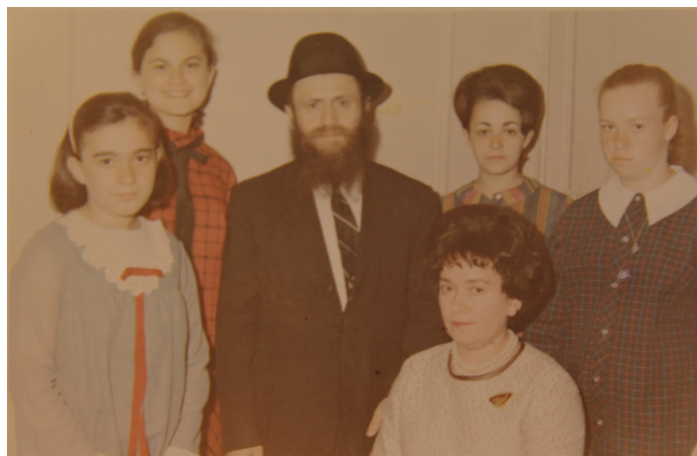
עם יבל"ח רעייתו ובנותיו