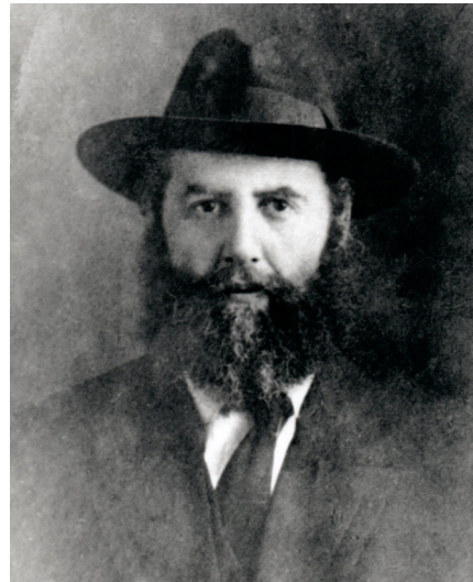
כ"ק אדמו"ר מוהריי"צ נ"ע - תר"ע (לערך)