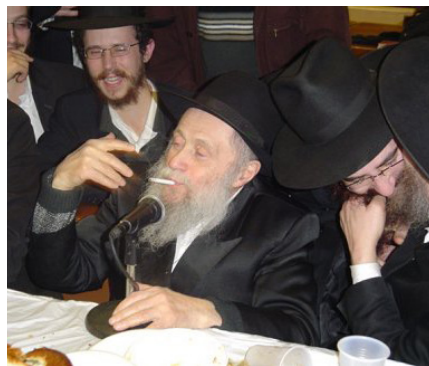
מתוועד בבית חיינו 770