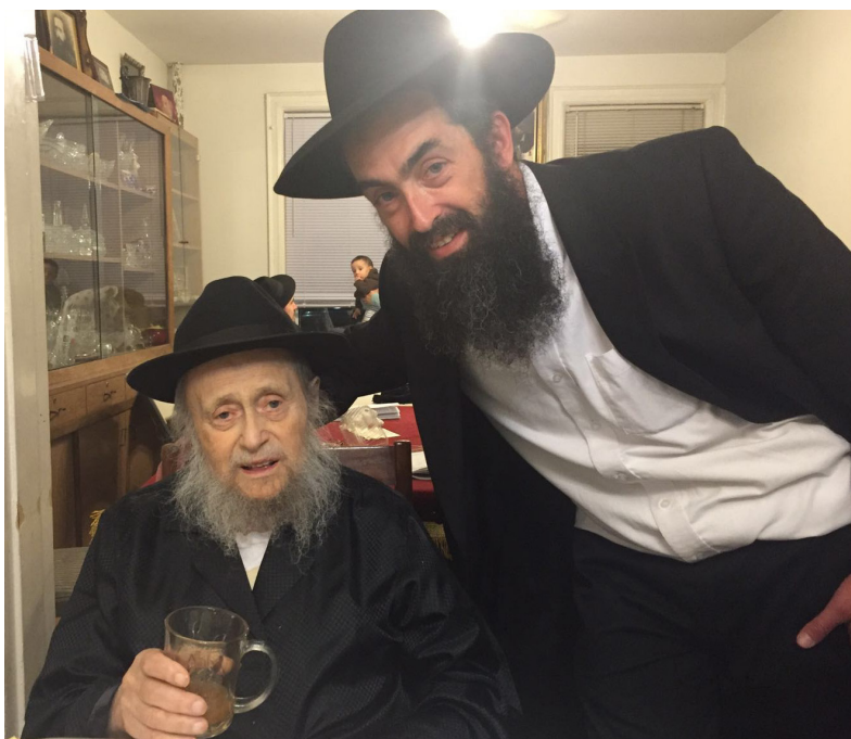
עם נכדו אבי הכלה