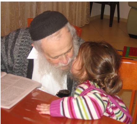
עם גינתו הכלה