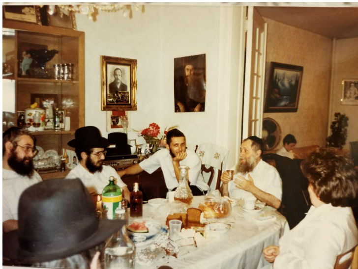
בביתו עם משפחתו