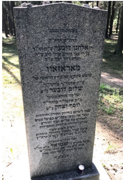
מצבה שהוקמה באזור בו נקבר