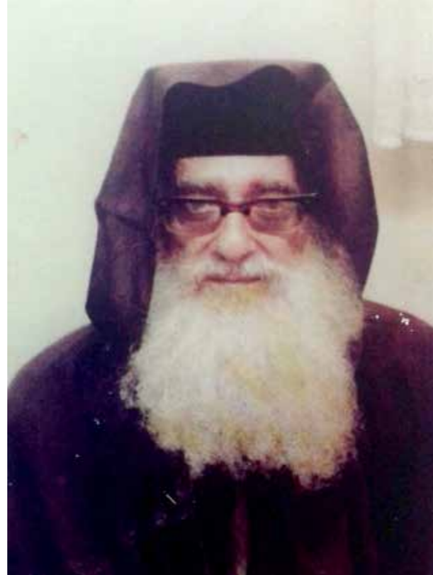
"אבי הרשים מאוד את הבבא מאיר בידיעותיו בתורה, שאף התבטא כי דיינות שישבו אצלו בחדר לא הראו שליטה כה נרחבת". הבבא מאיר צ'וק"ל

"בארפוד אבי התגורר אצל משפחת בן חמו המכובדת, שאירחו אותו ודאגו לכל מחסורו. אבי התמסר במרץ לניהול המוסדות, כאשר התקציב למימון המוסדות ניתן מהג'וינט. 'בתקופה הראשונה כמעט ולא נוצר קשר ישיר בין אבי לבבא מאיר, שהיה מטבעו איש סגור ומופנם ולא נהג לצאת מחדר לימודו. ואולם לאחר זמן, התקבלה הזמנה לביקור מבית המרא דאתרא. בפתח הביקור, בבא מאיר התפלא באוזני אבי, על כך שעד עתה נמנע מלבקר ולפקוד את בית המרא דאתרא כנדרש". התפנית בעלילה ובטיב הקשר בין הבחור הצעיר למשפחת