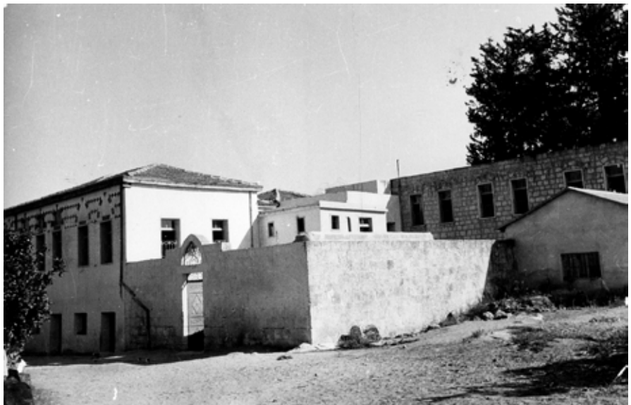
תורה מפוארת מתוך הדחק. ישיבת 'תומכי תמימים' המרכזית בלוד, בימים ההם