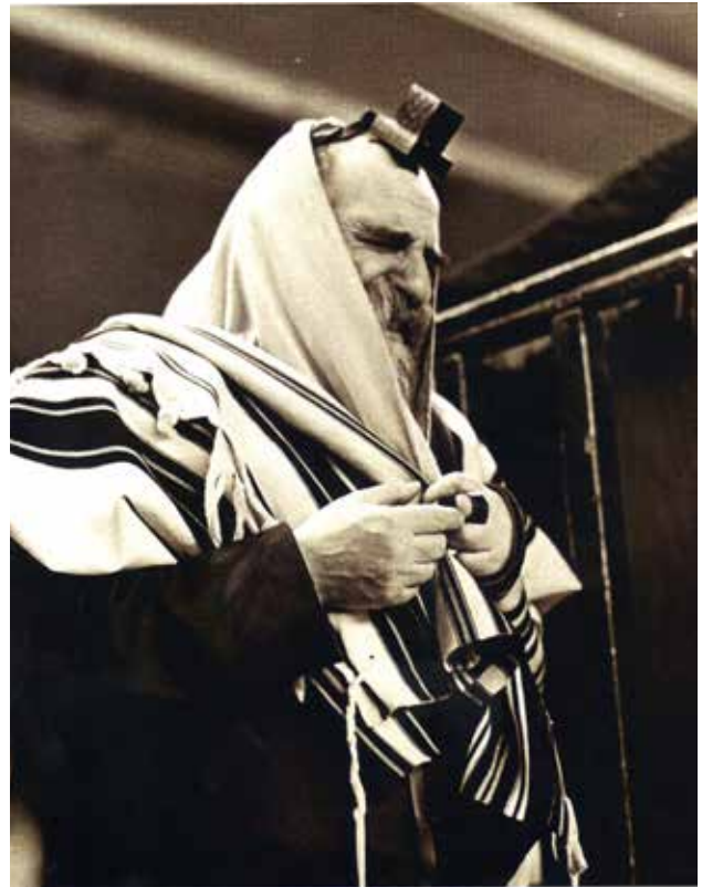
שעות צלותא. שופך נפשו בתפילה בבית מדרשו של הרבי