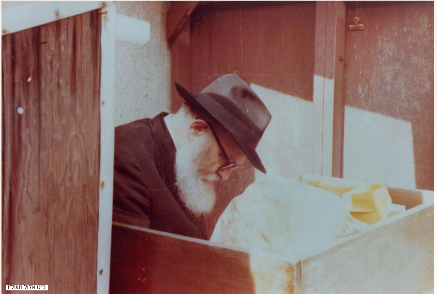
כ"ט אלול תשל"ו

ואז, כפי שמביא הרבי בלוח היום יום (כ"ב אייר), "דער רבי איז ניט עלענט און חסידים זיינען ניט עלענט" - הרבי אינו בודד, והחסידים אינם בודדים.