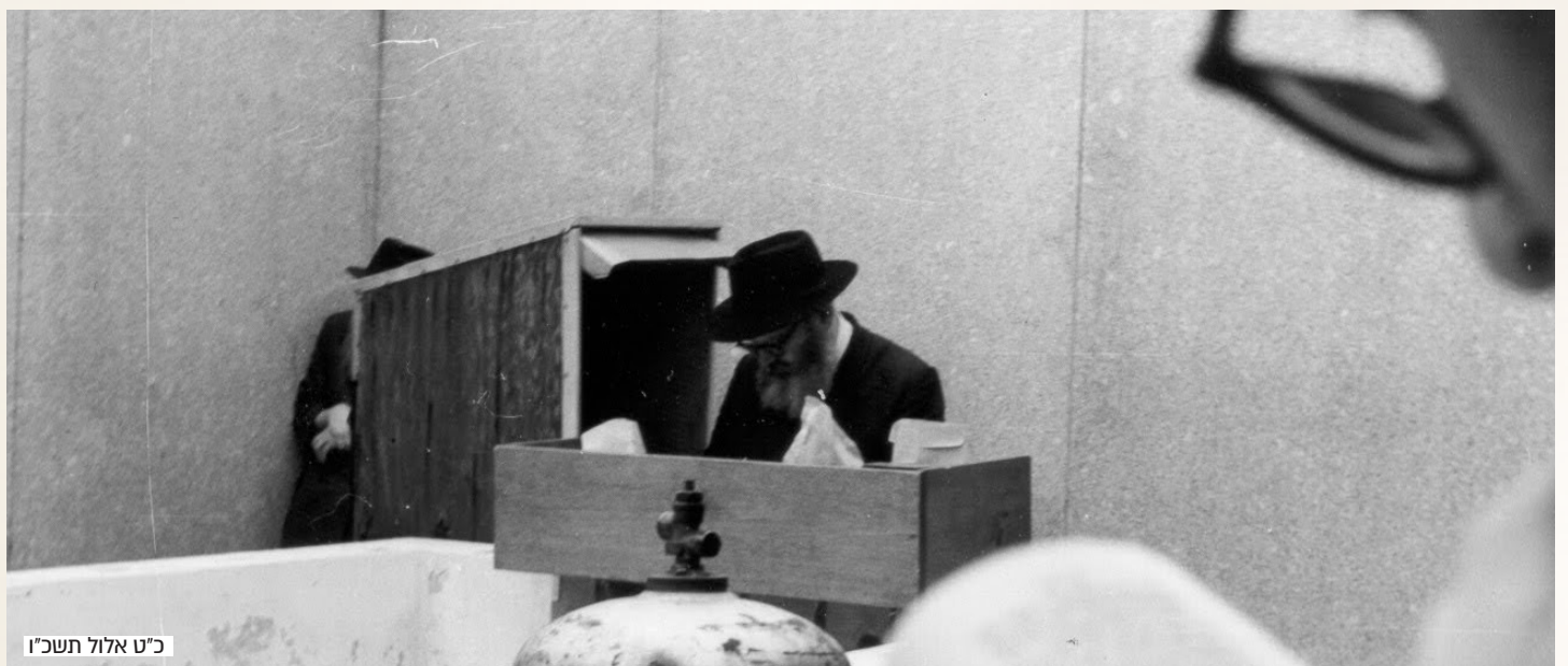
כ"ט אלול תשכ"ו

כמו שקודם אלו שלמדו חסידות וכל החיות שלהם הייתה סביב חסידות וחסידים ומה שקורה ב770 - חיו והרגישו שהרבי יודע אותם, יחידות פעלה שכל ההנהגה שלהם הייתה באופן אחר; ומי שלא - היחידות פעלה עליהם לזמן קצר, כך גם היום - זה תלוי בחסיד,