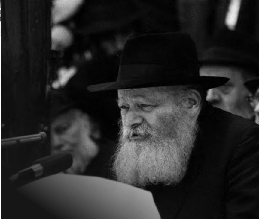
כשכואב צועקים. כ"ק אדמו"ר מליובאוויטש זי"ע במשא קודשו בבית מדרשו

"חוסר האמונה בדרכנו הוליד את גישת ההתגוננות והרתיעה מלהצטייר כתוקפנים, ובגלל גישה זו המערבת צידוקים מדיניים נשפך כמים דם יהודי, כאשר ההיסטוריה חוזרת על עצמה בדיוק מצמרר. לאחר מלחמת יום הכיפורים דיבר הרבי רבות על כך שימים ספורים קודם המלחמה הגיעו ידיעות שהצד השני (מצרים וסוריה) עורך גיוס כללי, ולמרות זאת לא אישרו בארץ לגייס את הכוחות שאמורים להגן על ארץ ישראל, עד כדי כך שבערב יום הכיפורים הייתה ידיעה ברורה שאם לא ירתיעו אותם – המלחמה תחל ביום הכיפורים. מומחי הביטחון הביעו את דעתם בפירוש שאם רוצים למנוע מלחמה ולחסוך בקרבנות, הדרך היחידה היא לגייס את הכוחות מיד ולפעול להגנת ישראל, אך המדינאים סירבו לעשות זאת כדי שלא להצטייר כתוקפנים. ההיסטוריה חוזרת על עצמה רח"ל, כאשר אנחנו מגיבים ומתגוננים לאחר מעשה ולא פועלים לכתחילה כדי להגן ולמנוע שפיכות דמים".