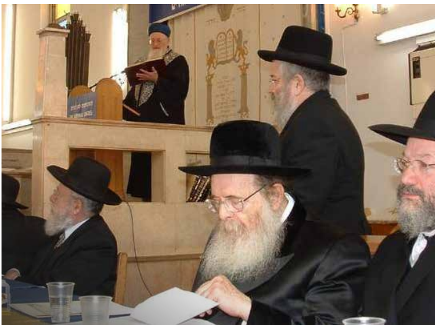
למען ציון לא אחשה. כנס ועד הרבנים 'פיקוח נפש'. שני מימין: האדמו"ר מסדיגורא זצ"ל. נואם: הגאון הרב מרדכי אליהו זצ"ל