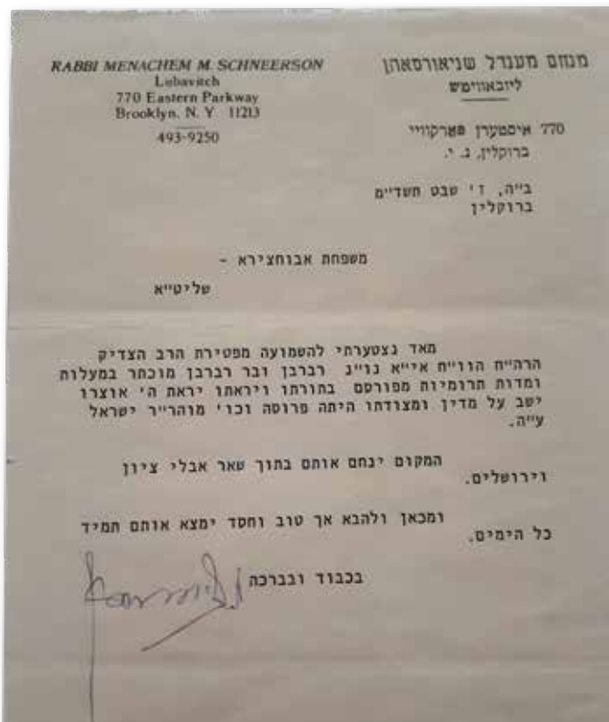
ברבן וברבן. מכתב התנחומים ששיגר הרבי למשפחת אבוחצירא לאחר פטירת הבבא סאל

זאת "מעולם לא ניצחני הקור". על פי עדות שקיבלתי מבני ביתו, היה טובל 100 טבילות. "בהודמות אחרת ביקשתי לשמוע ממנו על מעלת גידול הזקן, ואמר לי שהוזהר מקפיד מאוד שלא לנגוע בו ודיבר בחריפות נגד הנוגע בזקנו כמו גם רבנים וראשי ישיבות המתירים זאת. כששאלתי אותו על רבנים המסדרים את הזקן, נענה ואמר שאינו יכול להסתכל על פניהם. הוא סיפר לי על עצמו שעד גיל 40 לא גדל לו זקן, וכשיקש והתחנן לה' בבכיות על כך שמע לתפילתו ותוך שבוע התחילו שערות זקנו לצמוח. זכיתי לראות בעצמי איך היה מכבד אדם בעל זקן, ובפרט מי שהיה עם זקן ארוך והיה מנשקו בזקנו.