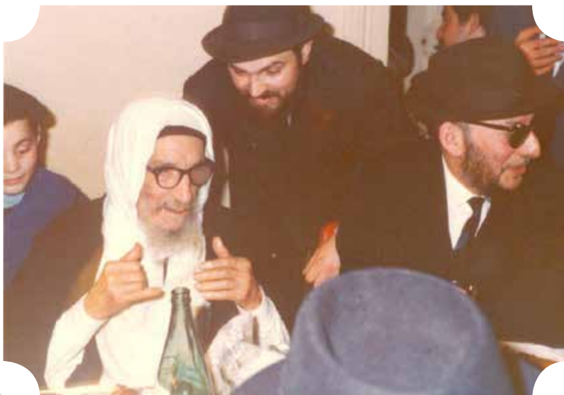
גילו צדיקים. הבבא סאלי בסעודה בעידנא דחדוואת

כאשר הגיעה לפרקה בתו הצעירה של הבבא סאלי, התדפקו על דלתותיו שידוכים נכבדים מבינם של גדולי עולם שרצו