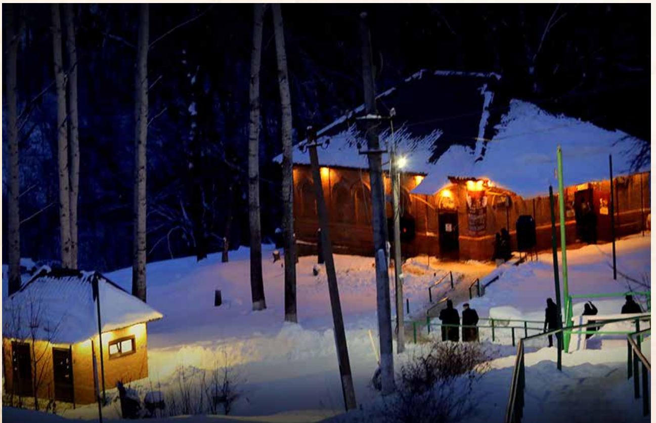
ציון כ"ק אדמו"ר הזקן בהאיטש

ו"נפש בהמית" הכוונה בעיקר לכוחות חכמה בינה ודעת שלהן. צריך להבין, שיש חלקים בנפש האלוקית שהם היצר הטוב שלה, ויש חלקים בנשמה שהם למעלה מזה ושם שורה יותר אור אין סוף. לפני שלומדים את ר' חיים של הנפש, כלומר לפני שמעמיקים בדברי אדמו"ר הזקן, נדמה לאדם שיש נפש אחת, שפעם היא נוטה לכאן ופעם לשם. יש לה גם חלקים טובים וגם חלקים רעים, וקוראים להם יצר טוב ויצר רע. אדמו"ר הזקן בא ואומר: לא! יש נפש אלוקית, ויש בה חלקים שלמעלה מיצר טוב, וגם יצר טוב. יש נפש בהמית, וגם בה יש חלקים שאינם היצר הרע, יש