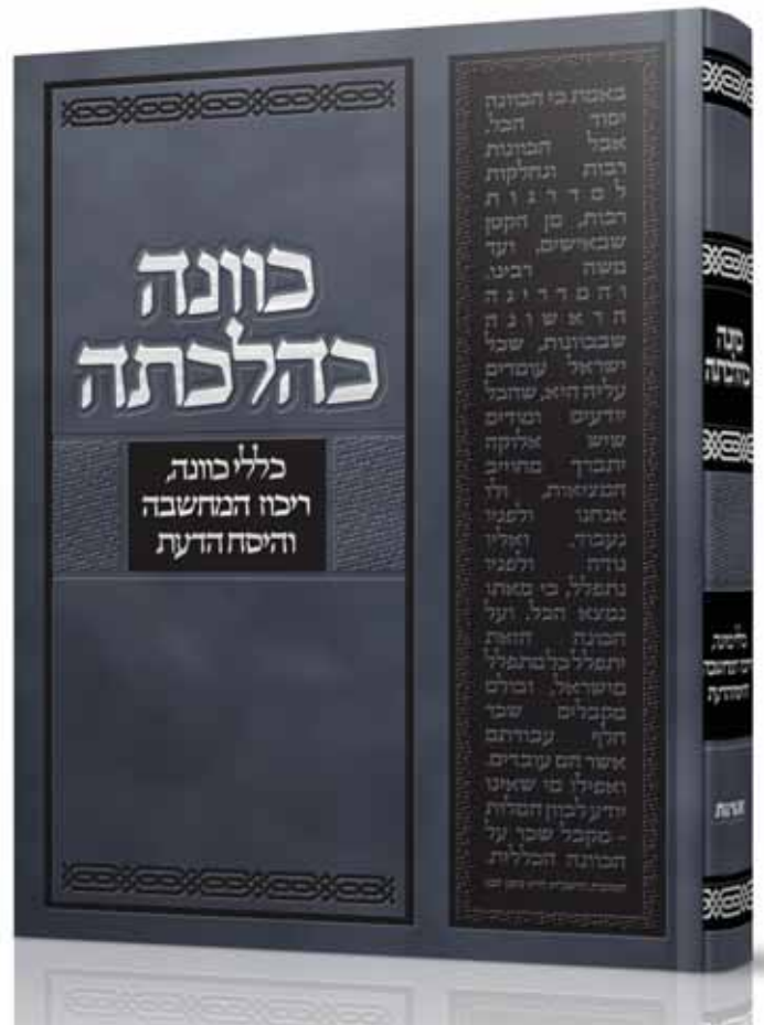
הספר 'כוונה כהלכתה' בברכתם הנלהבת של גדולי הפוסקים שליט”א

”כך הוא גם לגבי מחשבות טורדניות וכפייתיות – כל עוד המחשבה לא מבטאת את הדעת הפנימית של האדם, הרי אלו מחשבות לא רצוניות והמחשבות הטורדניות הן בלי שהאדם רוצה, כי הרצון הוא הדעת, ממילא אין שום משמעות למחשבות האלו”.