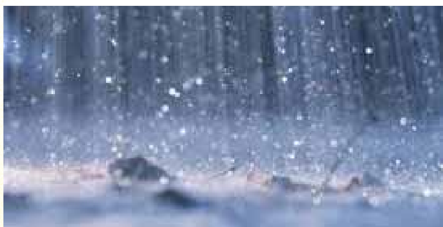
ומפני מה נקראין 'גבורות גשמים' מפני שירדין בגבורה