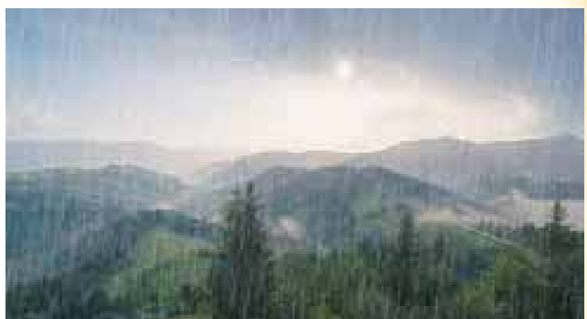
"קוונה הכל" - כוכבים בחלל

בטרם שנביא את הביאור במילות הברכה, נבאר כדרכנו את כללות תוכנה ומהותה. הברכה השנייה בשמונה עשרה הפותחת ב"אתה גבור", נקראת בחז"ל בשני שמות: "ברכת גבורות" [משנה ר"ה ל, א 'אבות וגבורות וקדושת השם']. וגם "תחיית המתים" [מזכירין גבורות גשמים בתחיית המתים" משנה ברכות לג, א]. הרי שמעיקרה ומהותה של ברכה זו, היא מורכבת משני מוקדים, מצד אחד היא ברכת "גבורות", וכלשון פתיחתה "אתה גבור לעולם ה'", וכן מסיימת - "מי כמוך בעל גבורות". ומצד שני היא ברכת "תחיית המתים" כלשון חתימתה "בא"י מחיה המתים". וגם נוסח הברכה מלא בהזכרות של תחיית המתים: "מחיה מתים אתה" רב להושיע, מכלכל חיים בחדס "מחיה מתים ברחמים רבים" וכו' "ומקיים אמונתו לישיני עפר". "מלך ממית ומחיה ומצמיח ישועה", "ונאמן אתה להחיות מתים" [נמצא שמזכירים עניין תחיית המתים חמש פעמים! בברכה זו]. והיינו, שכן שני העניינים מתאחדים לאחד, גם אם עיקר המטרה היא לפרט את גבורותיו של מקום, אזי תחיית המתים היא הגבורה הגדולה מתוכם, ובה מתבטאת עוצם גבורת הבורא.