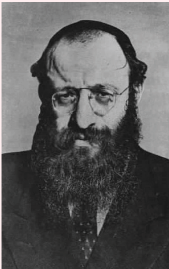
לעשות כמה שינויים ממעשה המכירה". הגה"צ רבי מיכאל דב וייסמנדל זצ"ל

בעניין זה, ושהיה כדאי ההפסד הזה כדי ללמד לקח זה לדורות! בסופו של דבר שאל את דעתו של כ"ק אדמו"ר ה'דברי יואל' מסאטמאר אם לערוך את ההצגה, ושאלו האדמו"ר מסאטמאר אם בפעם הקודמת כשעשו את ההצגה, בשנת תשי"ד, הרוויחו כסף, וכאשר ענה בחיוב, אמר לו שאם כן יכולים לעשותו בפעם הזו שכבר השקיעו בכך הון ואון רב.