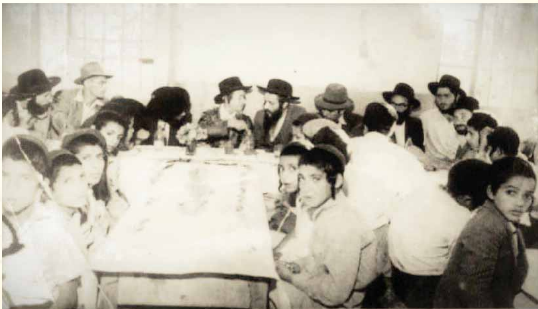
דמות פלאים. רבינו זצ"ל במסיבה של מצוה עם תלמידי ת"ת 'אור תורה' בטבריה

הרה"ק מרוזין זי"ע אמר: בני אדם חושבים שאהבת ישראל הוא לטפוח על כתף הזולת. אהבת ישראל הוא שכאשר כואב ליהודי בקצה העולם והוא מרגישו, זוהי מידת אהבת ישראל.