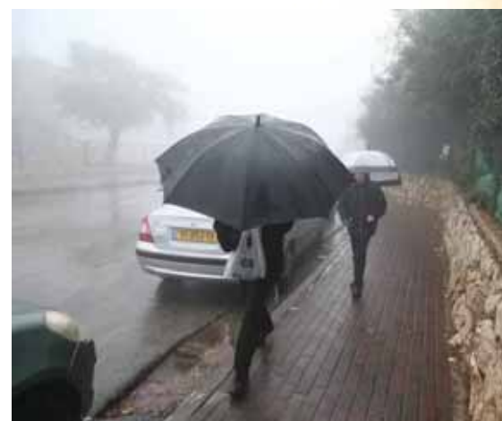
משיב הרוח ומוריד הגשם

ובכוזרי (מעמך שלישי א - ל): 'בברכה השנייה הנקראת גבורות יכוון המתפלל כי לא-לוה בעולם הזה ממשלה מתמדת, לא כמו שיחשבו חכמי הטבע כי העולם יסודו בטבעים הידועים מן הניסיון, ויחשוב כי הא-לוה מחיה מתים בעת שיעלה רצון לפניו אם כי דבר זה רחוק מן ההיקש ההגיוני של חכמי הטבע