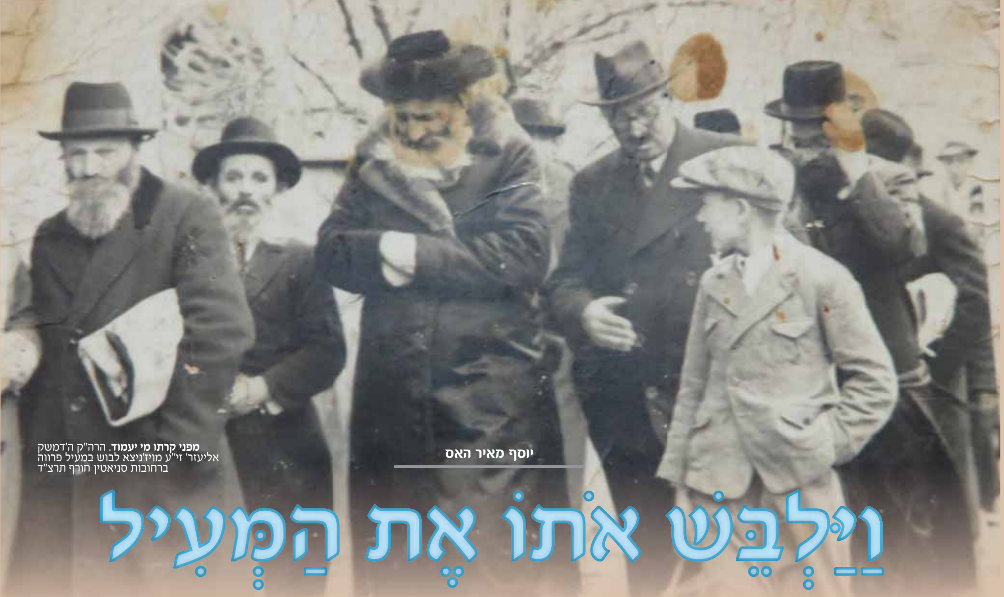
מפני קרתו מי יעמוד. הרה"ק ה'דמשק אליעזר ז"ל מו"צ ניצא לבוש במעיל פרווה ברחובות סניאטין חורף תרצ"ד