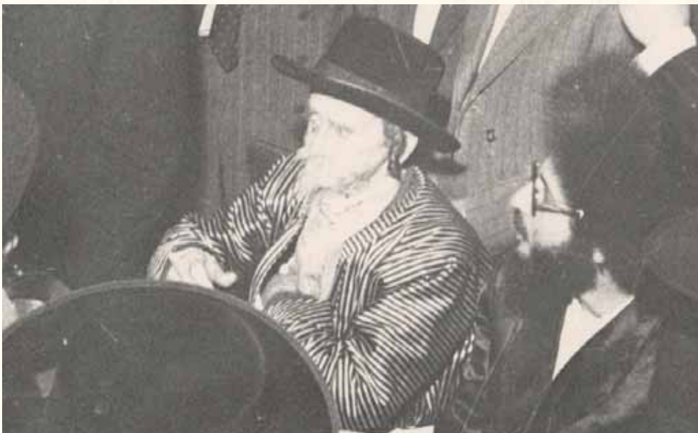
מראה פניו של רבינו זצ"ל