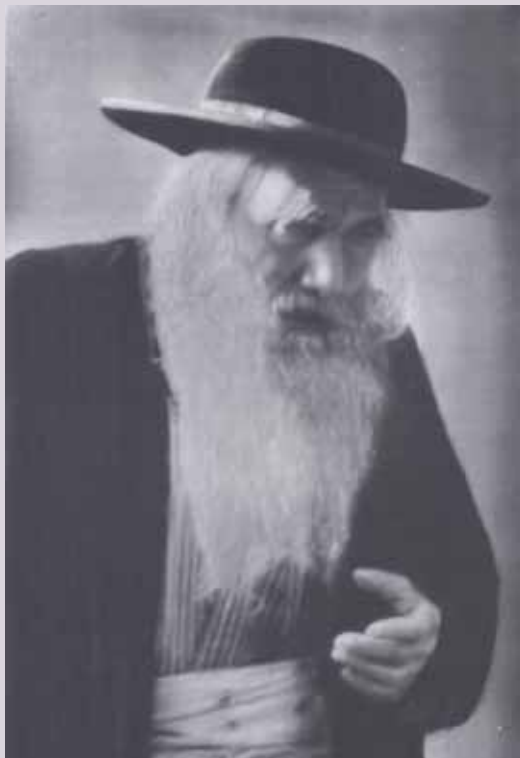
הגה"צ רבי יוסף חיים זוננפלד זצ"ל

היחידה שממנה הוא מפרנס את אשתו וילדיו הקטנים, אבל לא ניסה להניאו, כי ידע שעם רבי חיים אין מתווכחים בעניין הנוגע לכבוד שמים ושום מכשול לא יעמוד בדרכו למנוע חילול השם, אפילו אם יצטרכו הוא ומשפחתו לרעוב ללחם.