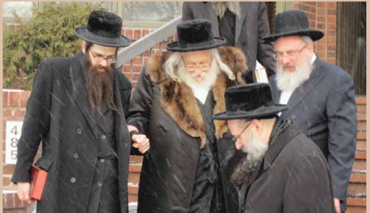
משליך קרחו כפתים. כ"ק מרן אדמו"ר מראחמיסטריווקא זצוק"ל - ארה"ב לבוש במעיל ופעלץ

אכן, הלה יצא באישון לילה ובחירוף נפש לחפש בגטו מלבוש ה'ראזשוואלקע', ולבסוף מצא אצל אחד משוכני הגיטו מלבוש זה, והביאו לפני מרן מהר"א זי"ע שהמתין והתעכב לקריאת התורה