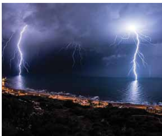
מי כמכה בעל גבורות

והנה כשביארנו באשרי כתבנו שהצניעו את חלק הנפילה, והעלימו את אות הנו"ן 'משום שיש בהם מפלתם של ישראל', ושבת זה מובן רק ברמזיה מתוך הפסוק בהמשך, וכך גם בברכת גבורות אף שהמטרה לברך ולשבח על כלל גבורות ה', אין מזכירים אלא את חלק הטוב והתקומה. ומתוך כך מתעוררים לראות גבורת ה', שהרי הוא זה שסומך נופלים ואם כן בידו הגבורה לקבוע מי מן הנופלים ייסמך, ומי מן החולים ירפא, ומי מן האסורים יותר. והן הן גבורת גבורותיו המעוררים פחד ויראה אצל כל הנבראים. ובסוף הברכה מזכירים פעם אחת במפורש את צד השלילה 'מלך ממית ומחיה ומצמיח ישועה'. בכדי להדגיש כי הוא מלך המחיה אפילו את המתים מזכירים גם כי הוא מלך ממתים, ובסופו של דבר הוא מחיה.