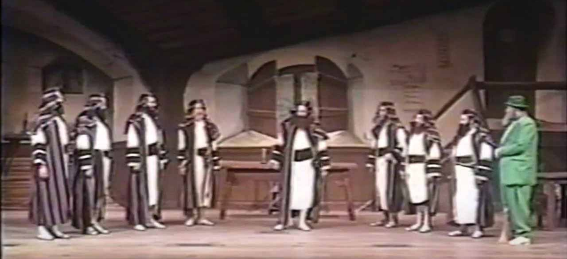
ה'שפילערס' ב'יוסף שפיל' בשנת תנש"א