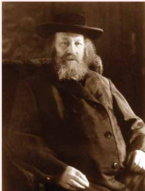
"ראוי לבטל הדבר". מרן מהרי"ץ דושינסקי זצ"ל

ואלו הם הסברות לשלילת ה'יוסף שפיל' שהעלה רבה של סעליש: עצם הדבר של עריכת 'פורים שפיל' מאבותינו הקדושים ושבטי י-ה, יש בו, אולי, משום זילות כבודם. אולם