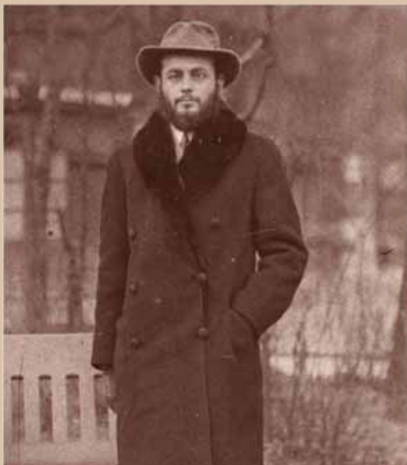
מעיל של קודש. כ"ק מרן אדמו"ר מליובאוויטש צוק"ל בצעירותו בפריז עם מעיל פרווה