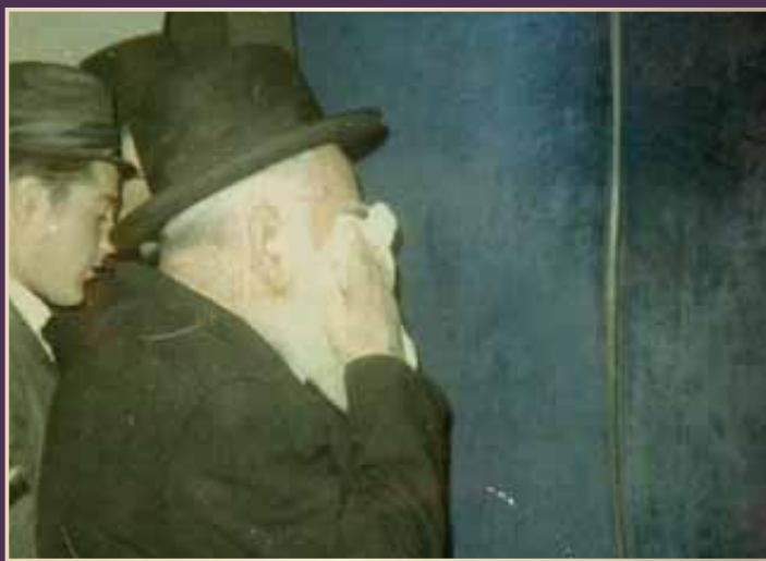
מרן הגר"ח שמואלביץ זצ"ל מתפלל בדמעות בקבר 'מאמע רחל' ערב ר"ה תשכ"ט

לשאלות הארות והערות אפשר לפנות לכתובת המערכת, ולציין 'עבור עם סגולה'