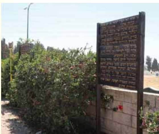
ברכת "מחיה המתים" על הקברות

הוא גם מתייחד בתפקיד "מנהיג" את העולם. וזה מתבטא בעיקר בשני חלקים שאין בהם קביעות: א. שהוא משפיל ומרומם. ב. מספק מזון לבריות.