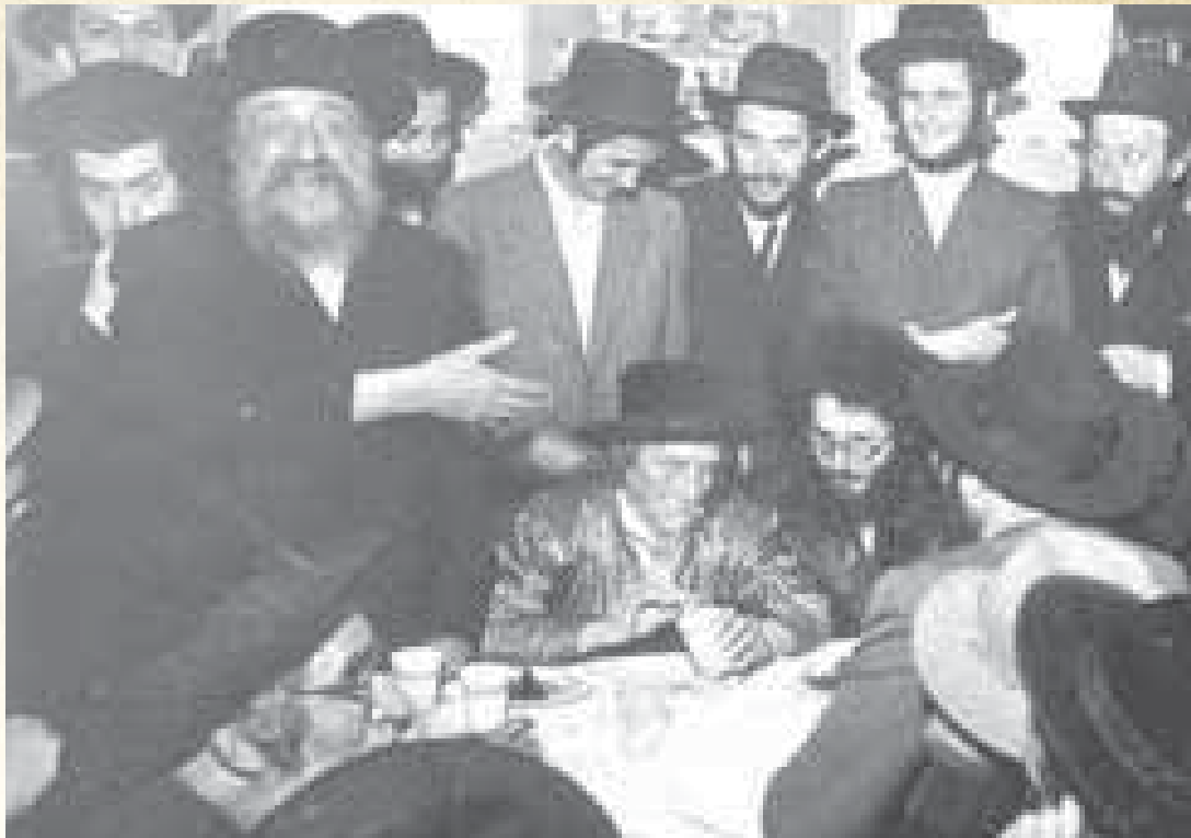
רבינו זצ"ל יושב בשמחת חתונה בראש השולחן