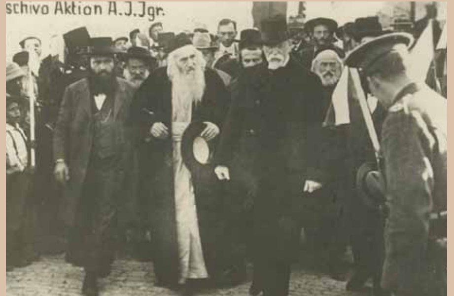
בגדי קודש הם לכבוד ולתפארת. מרן הגר"ח זוננפלד זצוק"ל לבוש במעיל עליון בקבלת פנים לנשיא צ'כסלובקיה שהגיע לביקור בירושלים עיה"ק