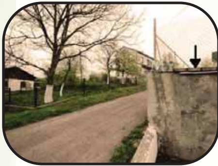
שטח ביה"ח בעיר סקאהל