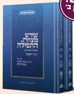
שורש מצוות התפילה לאדמו"ר הצמח צדק עם ביאור הרב שטיינזלץ