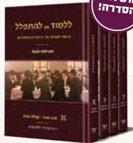
ללמוד איך להתפלל שבת 4 כרכים הרב שניאור זלמן גופין