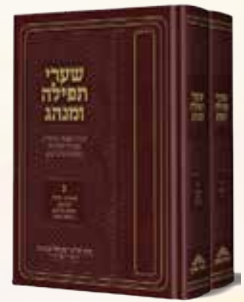
שערי תפילה ומנהג הרב מרדכי שמואל אשכנזי