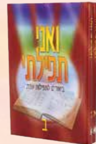
ואני תפילתי 2 כרכים הרב ניסן מינדל