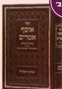
אוסף אמרים תפילה