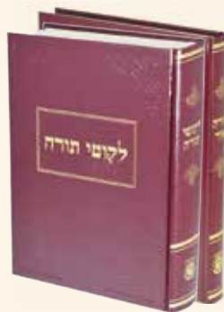
ליקוטי תורה ותורה אור ב' כרכים