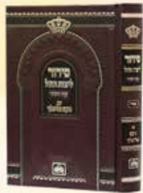
סידור נועם אלימלך