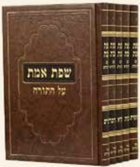
שפת אמת ה' כרכים