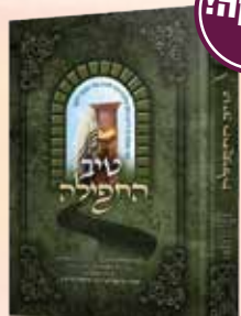
טיב התפילה הרב גמליאל הכהן רבינוביץ