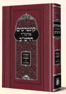
קונטרס התפילה והעבודה אדמו"ר הרשב"ב מליובאוויטש