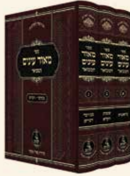
מאור עינים המבואר ג' כרכים