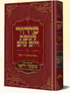
סידור טעמו וראו שבת