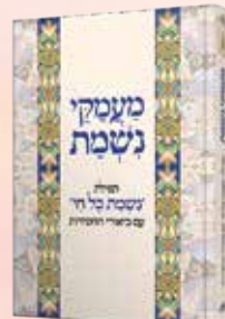
מעמקי נשמת הרב מנחם ברוד