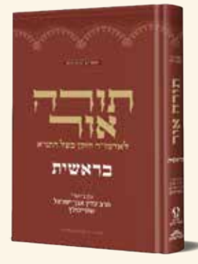
תורה אור בראשית | הרב שטיינזלץ