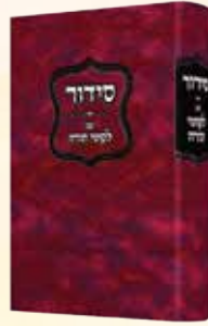
סידור עם לקוטי תורה אדמו"ר הזקן