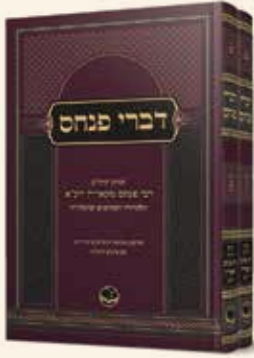
דברי פנחס תורת רבי פנחס מקוריץ