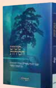
פשוט חסידות תפילה