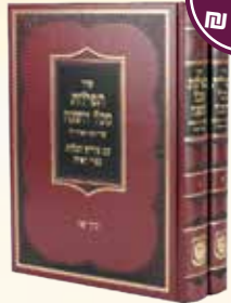
סידור עם דא"ח 2 כרכים אדמו"ר הזקן