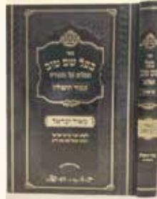
בעל שם טוב תפילה