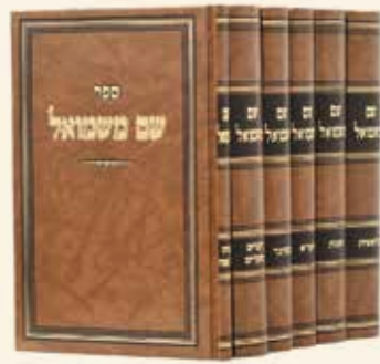
שם משמאל ו' כרכים