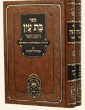
בת עין המבואר ב' כרכים