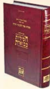
חסידות מבוארת תפילה