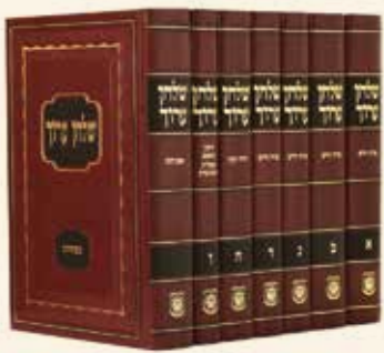
שולחן ערוך הרב ז' כרכים