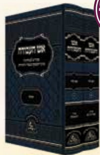
אש העבודה תפילה אש החסידות