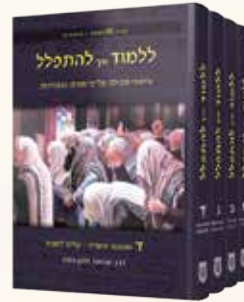
ללמוד איך להתפלל חול 4 כרכים הרב שניאור זלמן גופין