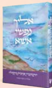
אליך נפשי אשא הרבנית וינגורט