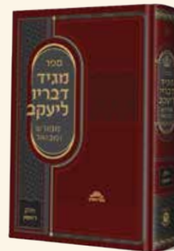
מגיד דבריו ליעקב המבואר א'