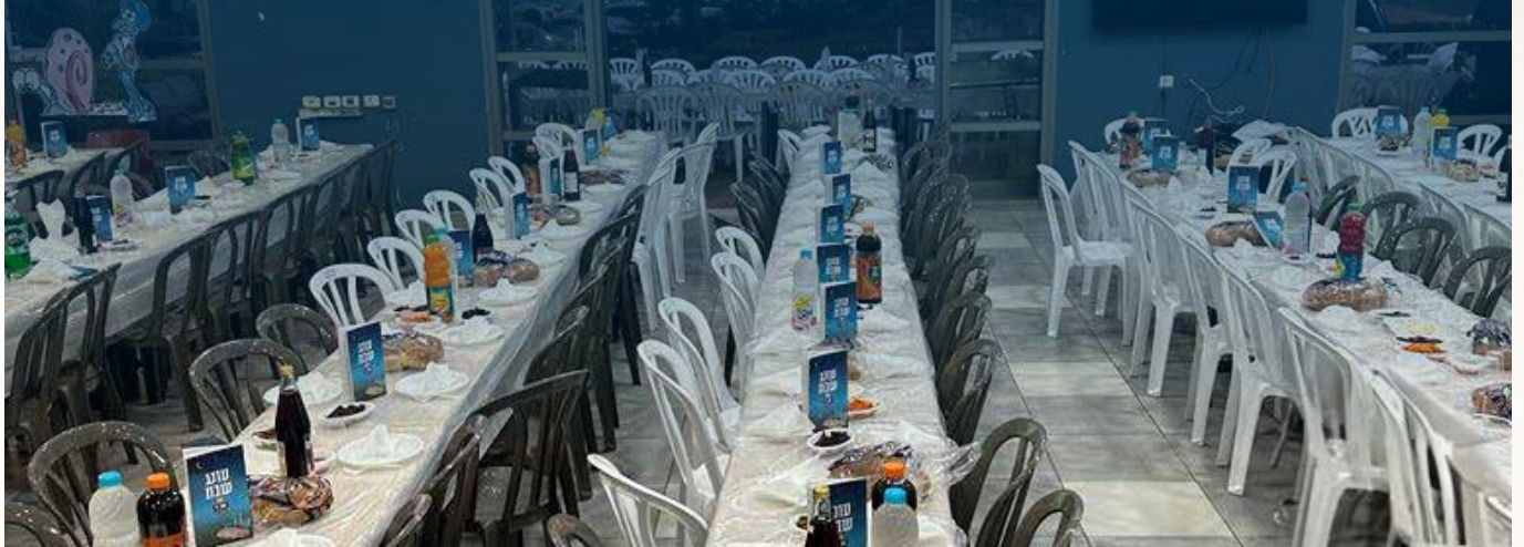
שולחנות השבת בקמפוס שנערכו ע"י השלוחים למשפחות המפונים

פליטים ועידוד החיילים. מרגש לראות כמה היהודים בגולה מרגישים את הכאב שלנו ונרתמים לסייע.