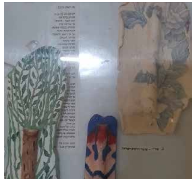
בית מזוזה עם סיפור מיוחד. הממצא המרגש שהתגלה בקיבוץ בארי