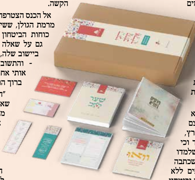
יותר מ-800 בנות נרשמו לתכנית הלימוד השנתית בתניא וקיבלו ערכה מלאה בחומרי לימוד ועזרים

היא שיתפה את הבנות בהתמודדות בימים שלאחר מכן, את הקושי לחזור לשגרה, גם לשגרה הרוחנית של תפילה ולימודים, ואת הכוחות