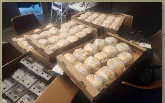
ארגזי סנדוויצ'ים מושקעים שהוכנו במועדון חב"ד לנוער ע"י הנערים