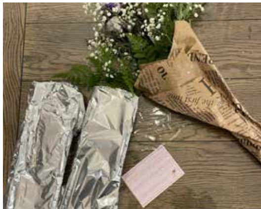
המתנדבות הצעירות שולחות גם עוגות ופרחים למשפחות הלוחמים

במיזם מיוחד של חב"ד לצעירים, מאות צעירות בכל הארץ שמרטפיות לילדי אבות שהוזעקו למילואים בגזרות השונות של המלחמה