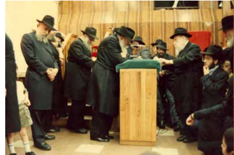
תמיד ליד הרבי. אל מול פני הקודש בעת שיחה