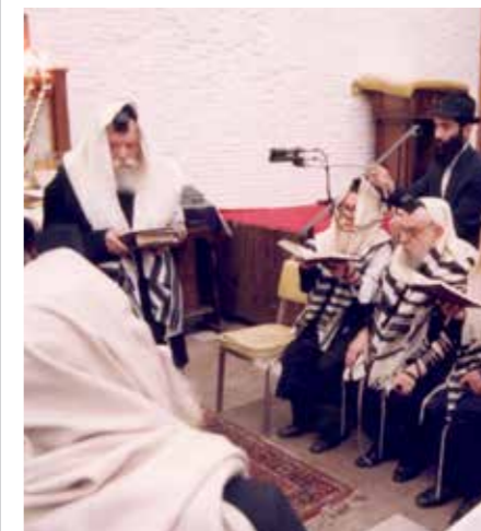
הרב גוראריה (שני מימין) בין עשרת הרבנים בהתרת נדרים של הרבי בערב ראש השנה