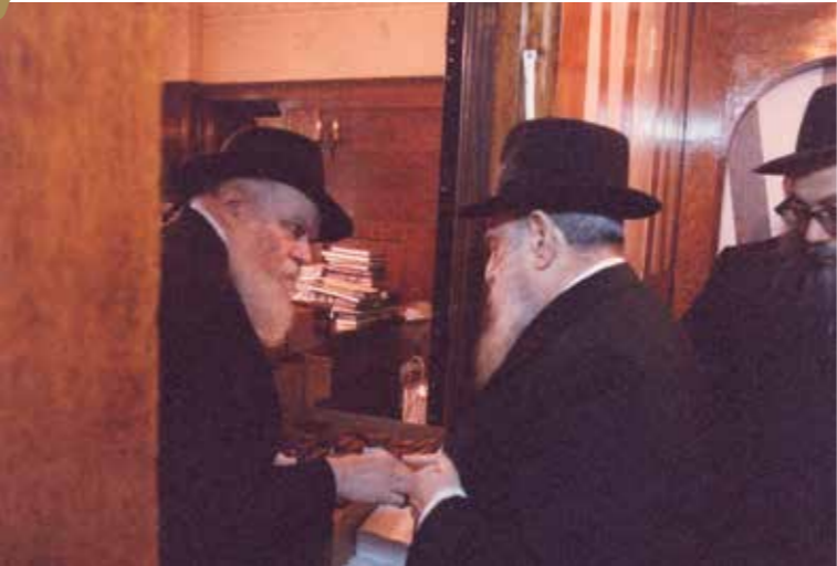
לשנה טובה ומתוקה. בקבלת לעקאה מהרבי בערב יום הכיפורים