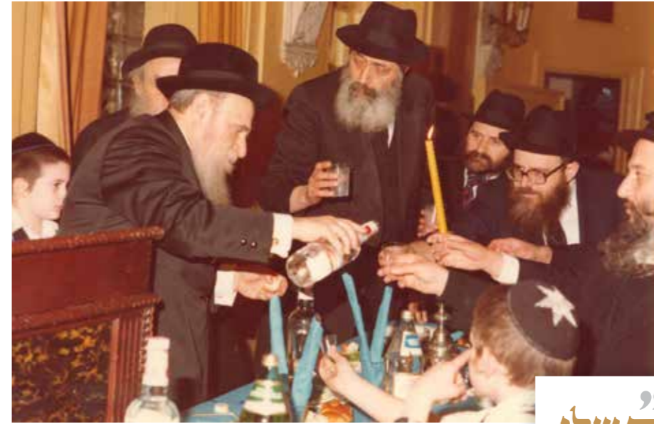
חלוקת משקה מהרבי במלוה מלכה לטובת מבצע נשי"ק