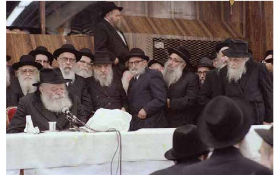
JEM | 206065

"כל כולו היה התקשרות לרבי, וכך חייך את משפחתו ואת כל סביבתו - שהרבי יהיה במוקד ומרכז החיים, ותמיד תמיד יש לעשות עוד ועוד בענייניו של הרבי'."