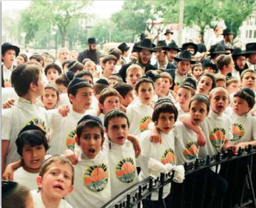
ילדי הקעמפים שרים "אוי רבי" מחוץ לחלון חדרו הק' של הרבי, כ"ף מנחם אב תשנ"ב