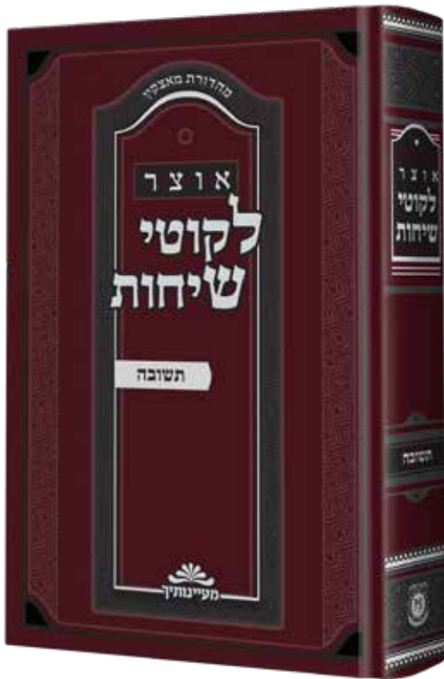
עומק לפנים מעומק. שער הספר החדש

כלומר, בפשטות, הגורם הנפשי לכישלונו של האדם בחטא הוא העובדה שפרק מעליו עול מלכות שמים באותה שעה. ולכן, כאשר שב בתשובה, לא די לו שיתחרט על החטא המסוים שבו נכשל ויחליט לבל