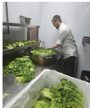
<< הבן של משפחת דבורקין בודק את החסה