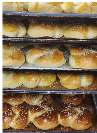
<< לחמניות לכבוד שבת

הסינים מעולים בלייצור את מה שמראים להם, ויכינו את המוצר