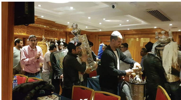
<< הכנסת ספר תורה בבית חב"ד