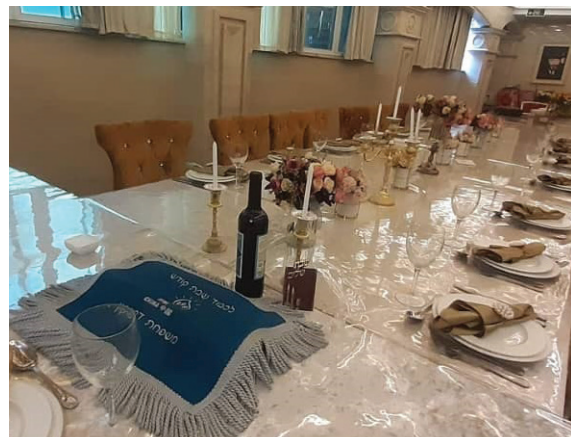
<< שולחן שבת קטן ומשפחתי בזמן הקורונה, כשסין היתה סגורה והיינו רק עם יהודים שגרים פה