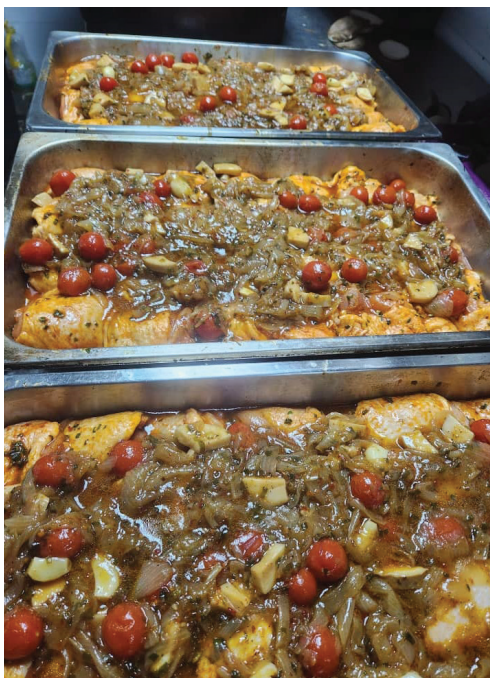
<< דגי מושט לכבוד שבת