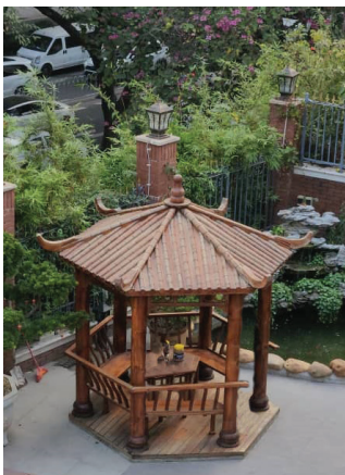
<< הנוף מהבית