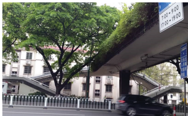
<< גשרים בכל מקום

מסין לארץ: חיקויים של נעלי מותג, תיקים, תכשיטים. עגלה לתינוק, שעונים, מגבות, משחקים.