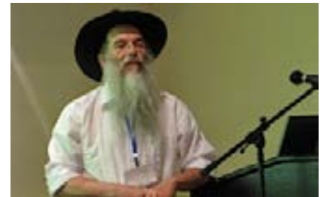
פרופסור מידובניק מרצה בכנס בינלאומי

אחרי הצבא הלכתי ללמוד רפואה בבאר שבע. חברים שלי לא ידעו על ההתחזקות הדתית שלי ולא מיהרתי לספר עליה. באותה תקופה הכרתי את אשתי, ובשלב מסוים גיליתי לה שאני מניח תפילין