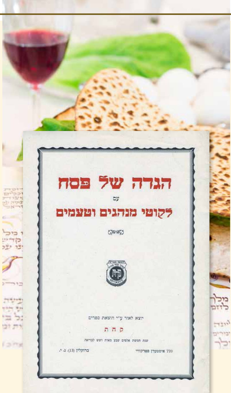
לא חסר ולא יתיר. שער הגדת רבנו זי"ע במהדורתה הראשונה, בשנת תש"ו

כלומר, בדרך כלל הנבראים התחתונים מרגישים את מציאותם ל"יש" מורגש ואילו הרוחניות נותרת רוחנית, אין; אמנם מועד אמירת הלל הוא זמן התגלות האמת האלוקית גם למטה, עד שהגשמיות הופכת כמו שאינה והרוחניות נוכחת כמציאות יש אמיתית.