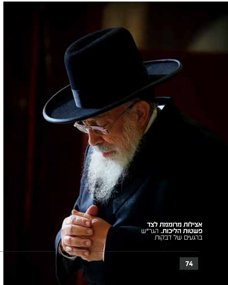
אצילות מרוממות לצד פשטות הליכות. הגרי"ש ברגנים של דבקות