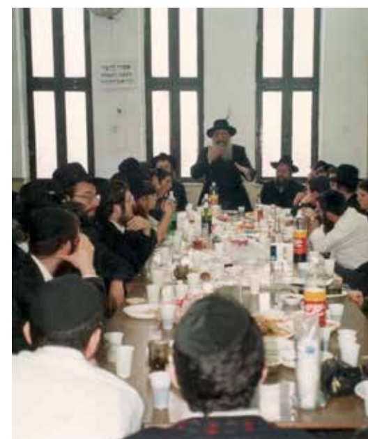
שיטה מיוחדת להציל את הנוער. בהתוועדות ארוכה עם תלמידיו