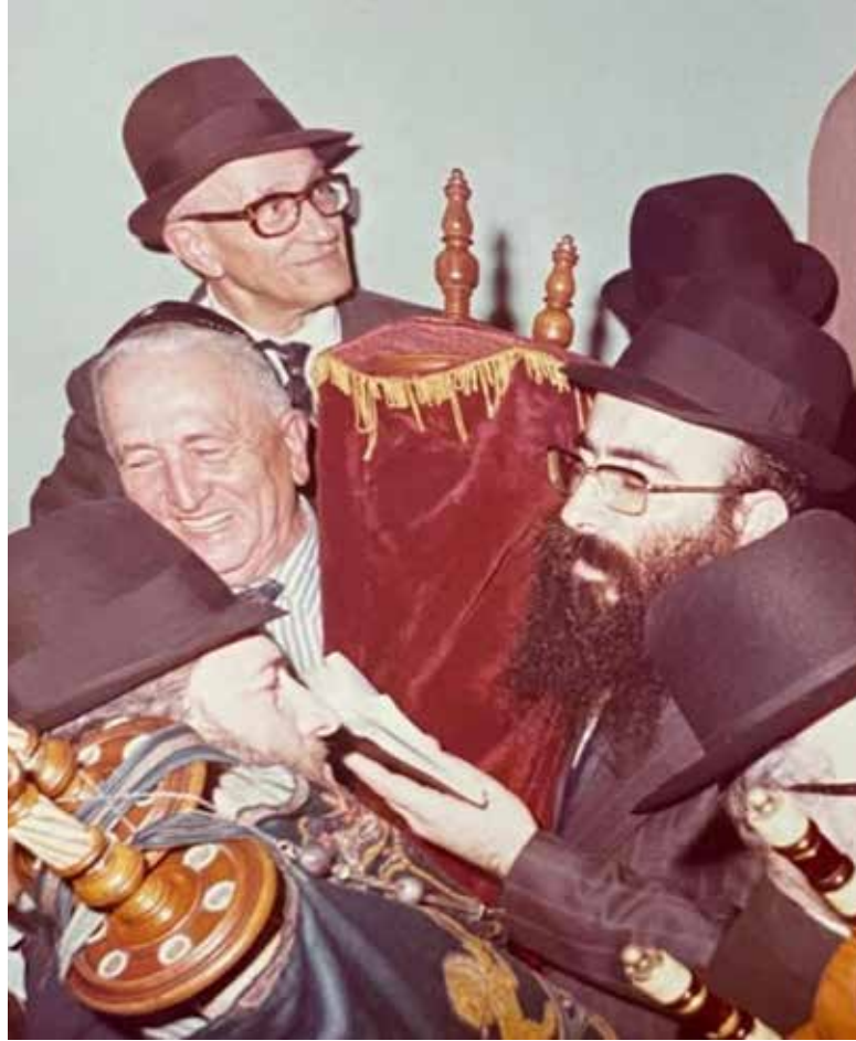
מהפכה תורנית מיוחדת. במעמד הכנסת ספר תורה לבית הכנסת חב"ד בבואנוס-אייס

כשהוא חוזר אל ירושלים החרדית, עינו החדה של הגר"ש אליטוב מבחינה בתופעה, שלציבור החרדי ייקח עוד כמה עשורים לזהות: 'הנוער הנושר'. הוא מחליט לגייס את כל המרץ והכישרון כדי לסייע.