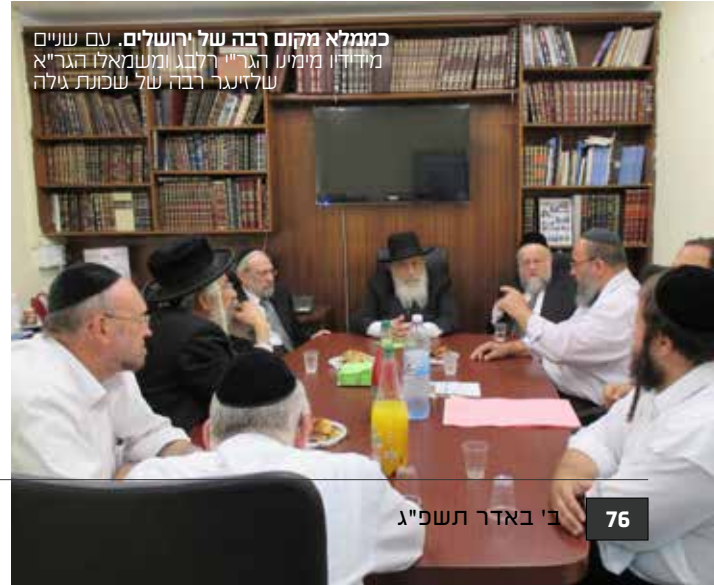
לשון לימודים. מאמריו של הגר"ש בביתאון 'שערים' כממלא מקום רבה של ירושלים. עם שניים מידידיו מיניין הגר"א רלב"ג ומשמאלו הגר"א שלזינגר רבה של שכונת גילה