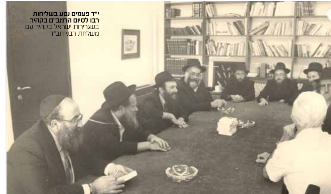
י"ד פעמים נסע בשליחות רבו לסיים הרמב"ם בקהיר. בשגרירות ישראל בקהיר עם משלחת רבני חב"ד