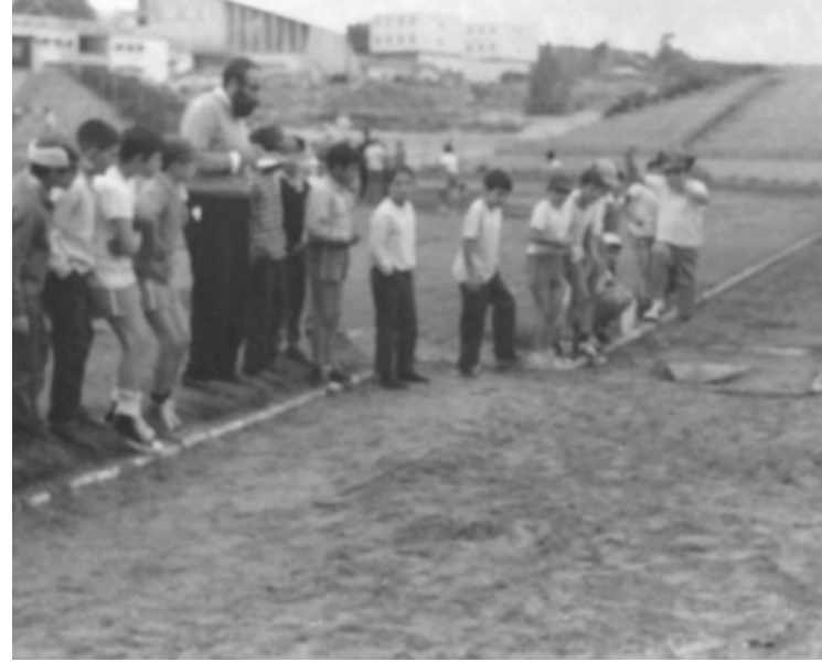
לגרום לכל ילד להאמין בעצמו. במשחק עם תלמידי ביה"ס חב"ד ביער גנים