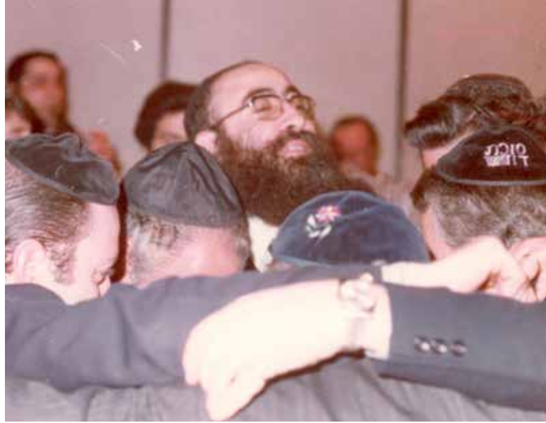
רוממות ושמחה חסידית. בריקוד עם בני קהילתו 'סוכת דוד' בארגנטינה

החלק השני הוא 'על העבודה' - התפילה. "לא אגזים אם אומר שכל המניינים שיש לנו היום, הכל כתוצאה מעבודתו של הרב אליטוב". כשהגר"ש הגיע לעיה, רוב הקהילה לא התפללה ביום חול במניין. "הוא דרש את הפסוק 'ביערתי הקודש מן הבית' - ואמר: יש להוציא את דברי הקדושה מהבית,