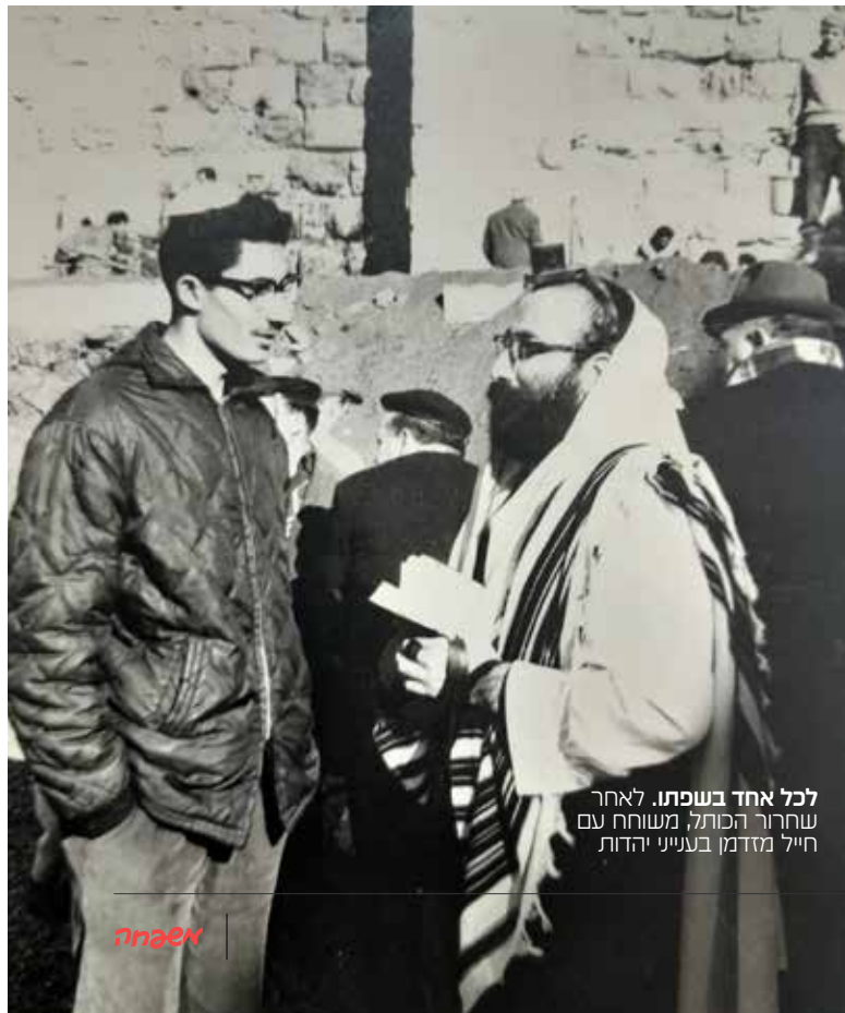
לכל אחד בשפתו. לאחר שחרור הכתל, משוחח עם חייל מזדמן בעיני יהדות