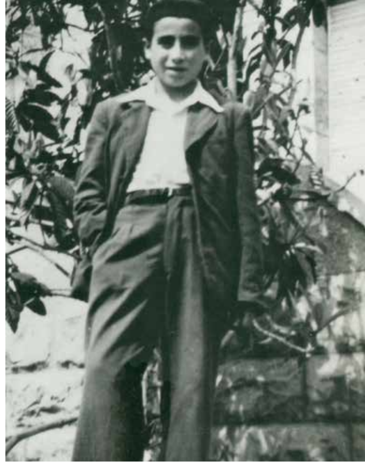
בבת אחת נעצרה הילדות. הגר"ש בילדותו בעיר העתיקה, לפני צאתו לישבת חדרה