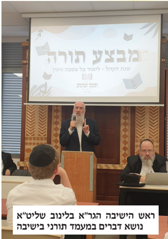
ראש הישיבה הגר"א בלינוב שליט"א נושא דברים במעמד תורני בישיבה