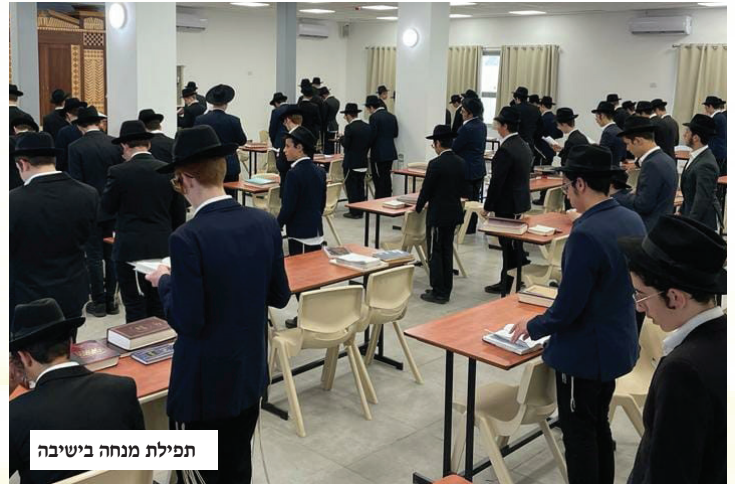
תפילת מנחה בישיבה