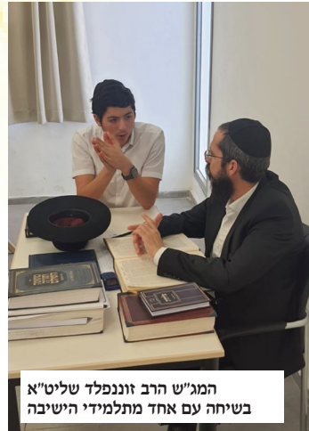
המג"ש הרב זוננפלד שליט"א בשיחה עם אחד מתלמידי הישיבה