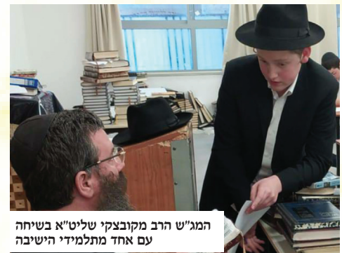
המג"ש הרב מקובצקי שליט"א בשיחה עם אחד מתלמידי הישיבה