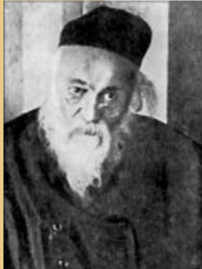
הרי הוא צודק. הגר"ח מבריסק זצ"ל

רבי חיים אמר שכדי לדון בדבריהם עליו לראות תחילה את הקונטרס. הביאו לו את הקונטרס והוא ביקש שיחזרו אליו למחרת. ואכן, למחרת חזרו אליו אותם מתחרירי ריב, אך מה השתוממו לשמוע ממנו את הדברים הבאים: "מה אתם רוצים, הרי הוא צודק".