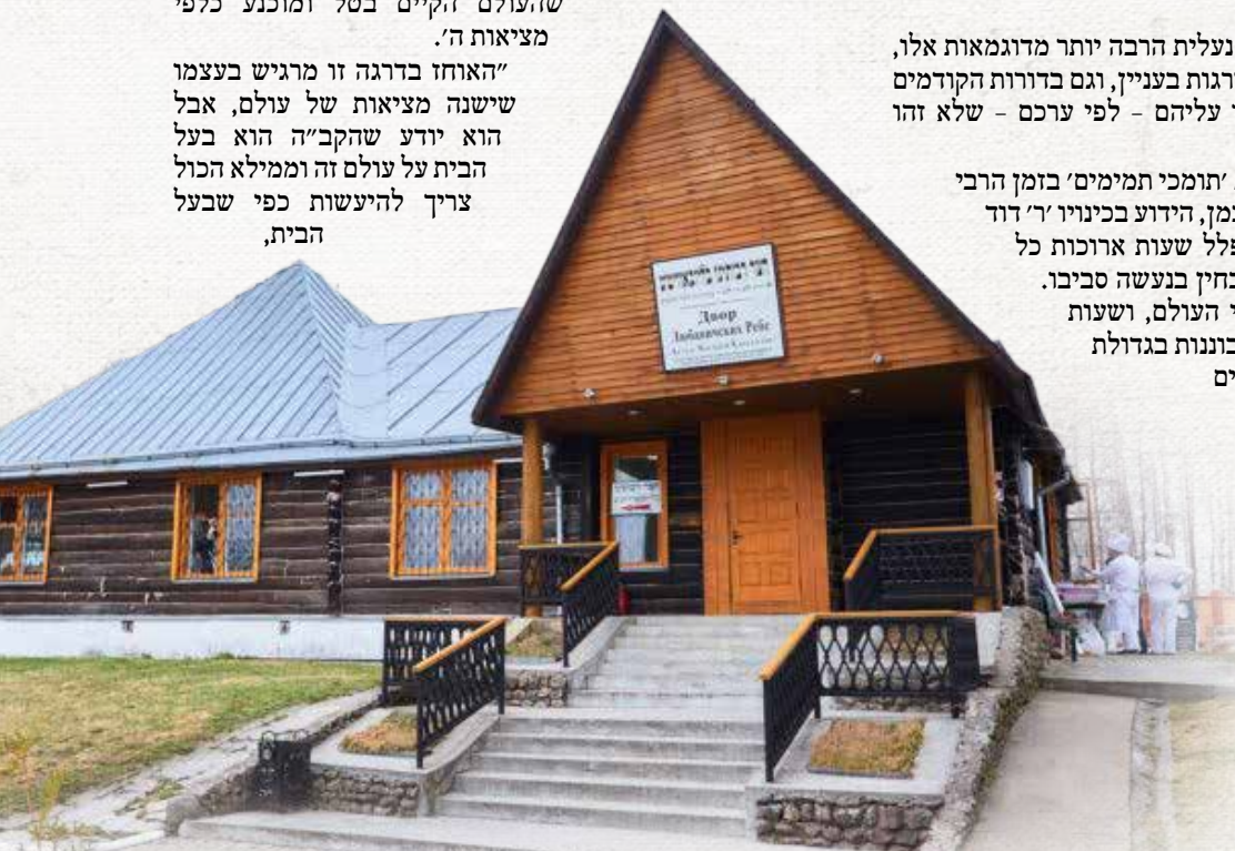
ייעודה של הישיבה הקדושה. השחזור של חצר רבותינו זי"ע בעיירה ליובאוויטש