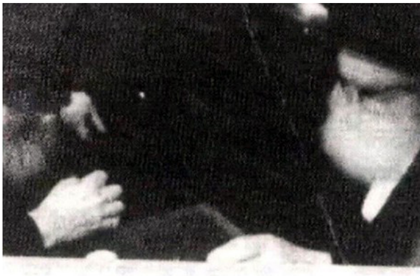
תמונה נדירה של האדמו"ר ה'לב שמחה' מגור, אצל הרבי. ט' אלול, ה'תשל"ח

מופלאות ו"שלא יבוש מפני המלעיגים". וכך אכן נהג ה"לב שמחה" כל שנות נשיאותו כאשר חרף את נפשו למען כלל ישראל תוך ביזוי ושיסויו של חוגי המתנגדים ולא שת ליבו אליהם כלל וכלל.