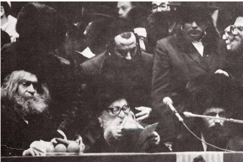
בתמונה: האדמו"ר ה'לב שמחה' מגור זצ"ל בסיום הרמב"ם הראשון בשנת תשמ"ה, ולצידו ה'פני מנחם' זצ"ל

היום ז' בתמוז חל היארציית של האדמו"ר מגור ה'לב שמחה' זצ"ל • העולם החסידי בכלל וחסידות חב"ד בפרט חבים חוב גדול לפועלו והנהגתו בקודש משפיעה עד היום על תחומים רבים • לאחר שהתמנה לאדמו"ר, הקדיש הרבי שיחה מיוחדת • לחם כארי למען 'מיהו יהודי', תמך בתקנות הקודש של הרבי ובסיומי הרמב"ם, ואף זכה מהרבי לעידוד רב בתקנת לימוד הירושלמי, כשהרבי ערך ברבים 'סיומים'