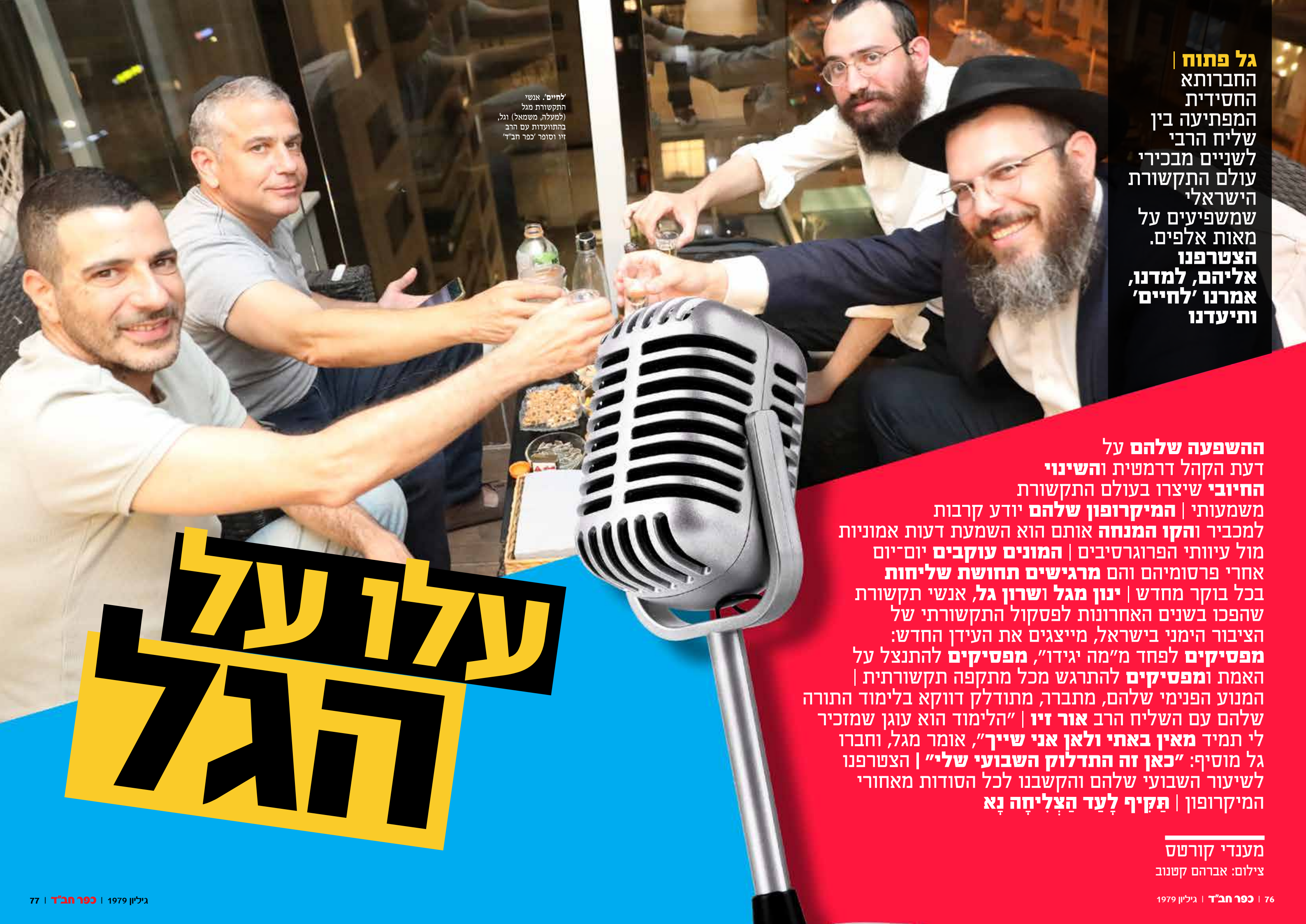
לחיים! אנשי התקשורת מגל (למעלה, משמאל) וגל, בהתוועדות עם הרב זיו וסופר 'כפר חב"ד'

גל פתוח | החברותא החסידיית המפתיעה בין שליח הרבי לשניים מבכירי עולם התקשורת הישראלי שמשפיעים על מאות אלפים. הצטרפנו אליהם, למדנו, אמרנו 'לחיים' ותיעדנו