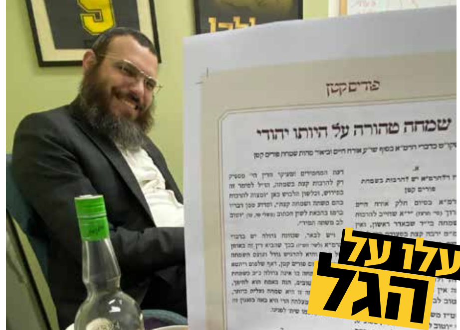
התלוק החסידי. תיעוד של נדב שטראוכלר מהחברותא השבועית בתורת הרבי

ילדים, בריאים, יושבים עם המשפחה בסעודות החג. אבל זו לא חוכמה. החוכמה היא לשמוח כששחוקים וגמורים. ברגעים הללו צריכים למצוא את הכוחות שיביאו לידי שמחה. גם כעת, בהתעודות, קל להיות שמח. נחמד פה עושים 'לחיים', מתרוממים. אבל מחר בשעת בוקר מוקדמת, כאשר צריכים להתעורר וללכת לעבודה, לפתוח מיקרופון ולהניח תפילין, כבר קשה ומורכב יותר. מאתגר יותר. לא קל לשמוח. אומרת לנו התורה: חגים והתעודות זה קל. אבל צריך לשמוח בשגרה. הקדוש ברוך הוא לא אוהב אנשים מתלוננים, קוטרם בעברית מדוברת. אבל איך אפשר להיות שמחים ביום מאתגר? הרב זיו הגיע מוכן גם לשאלה הזו ומשתף את הנוכחים בסיפור אשר לו היה עד. זה סיפור על חבד, מקורב, תושב תל אביב - זיו מציין