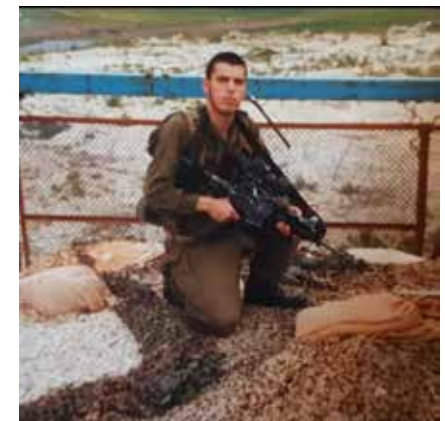
מהפך תודעתי. הרב זיו בימיו כלוחם בצה"ל

הטרור במחנה הפליטים המסוכן שממנו יצאו שורת פיגועים אכזריים ברחובות ארץ הקודש. ב'חומת מגן' חווה רגע מטלטל של סכנת נפשות. הוא עמד באחד הימים בעמדת חיפוי במחנה הפליטים. החיילים שתחתיו נכנסו לבתי מחבלים ברובים שלופים. ריות שרקו במרחב. לפתע הבחין שדלת הנגמ"ש המשוריין שבו עמד לא נסגרה. הוא הבין שהוא חשוף בפגל גופו העליון לחלוטין וקליע