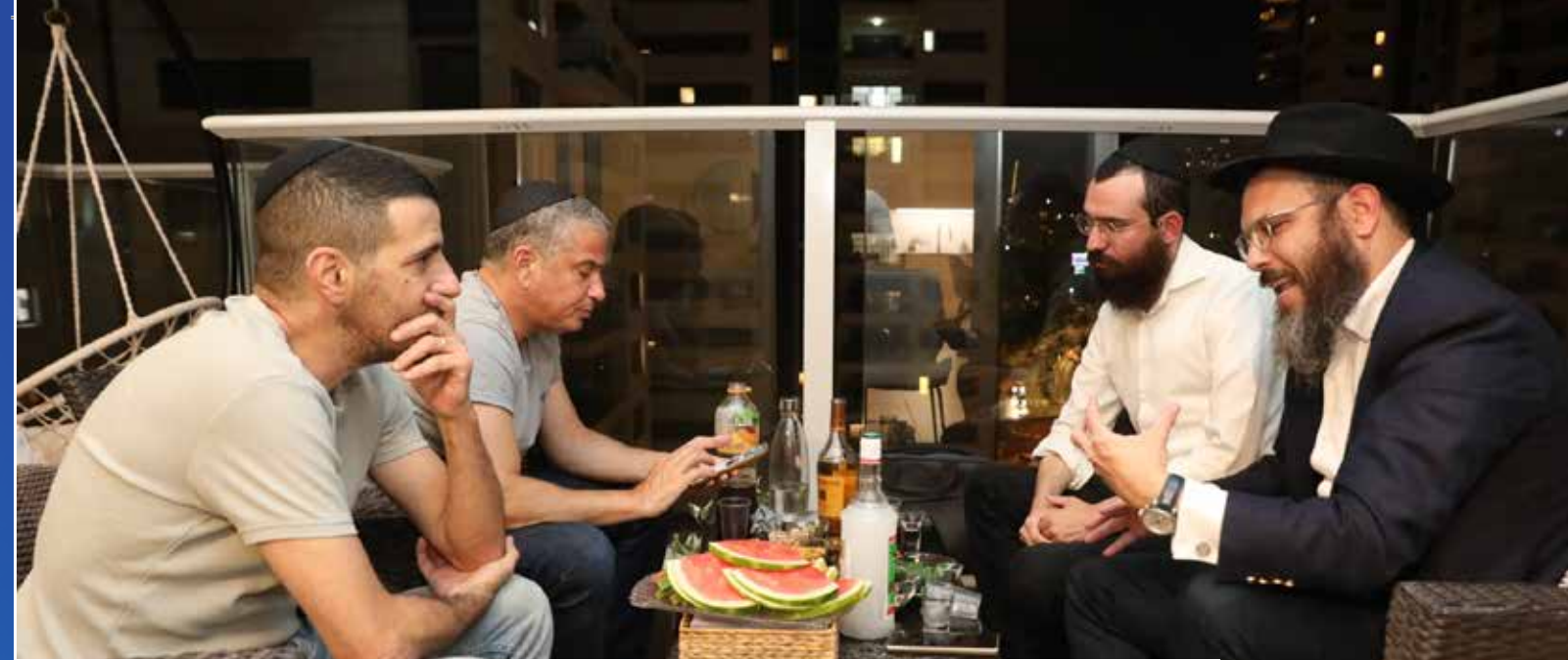
התוועדות לילית בפתח תקווה. שליח הרבי בקטמון, שני אנשי התקשורת הבכירים וסופר 'כפר חב"ד'

לפרטים והרשמה 1-700-55-770-1 | havineini.co.il