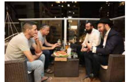
קביעות עיתים בחסידות. אנשי התקשורת בשעת הלימוד

אחרי שסיים שלוש שנות שירות נסע עם חבריו לטיול במדינות המזרח. השבוע הראשון היה בתאילנד. כשהגיעה שבת שאל את חברו איפה יש בית כנסת. הוא לא רצה לשבור את המנהג הקבוע שלו. החברים צחקו, אמרו לו לשחרר. זה תאילנד פה, עכשיו טיול, מה בית כנסת. אבל הוא, עקשן