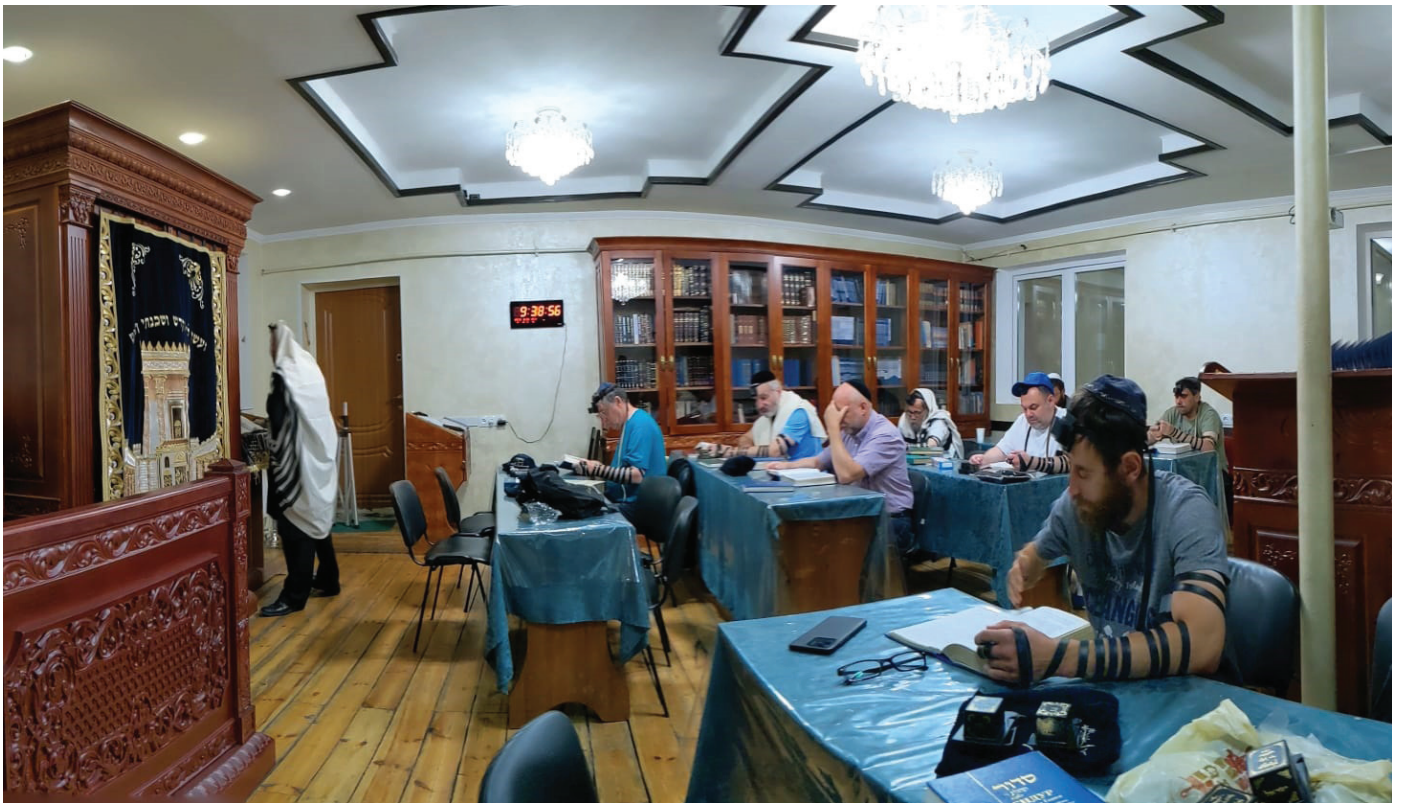
|| הפך למרכז פליטים. תפילה בבית המנסה בווינצה