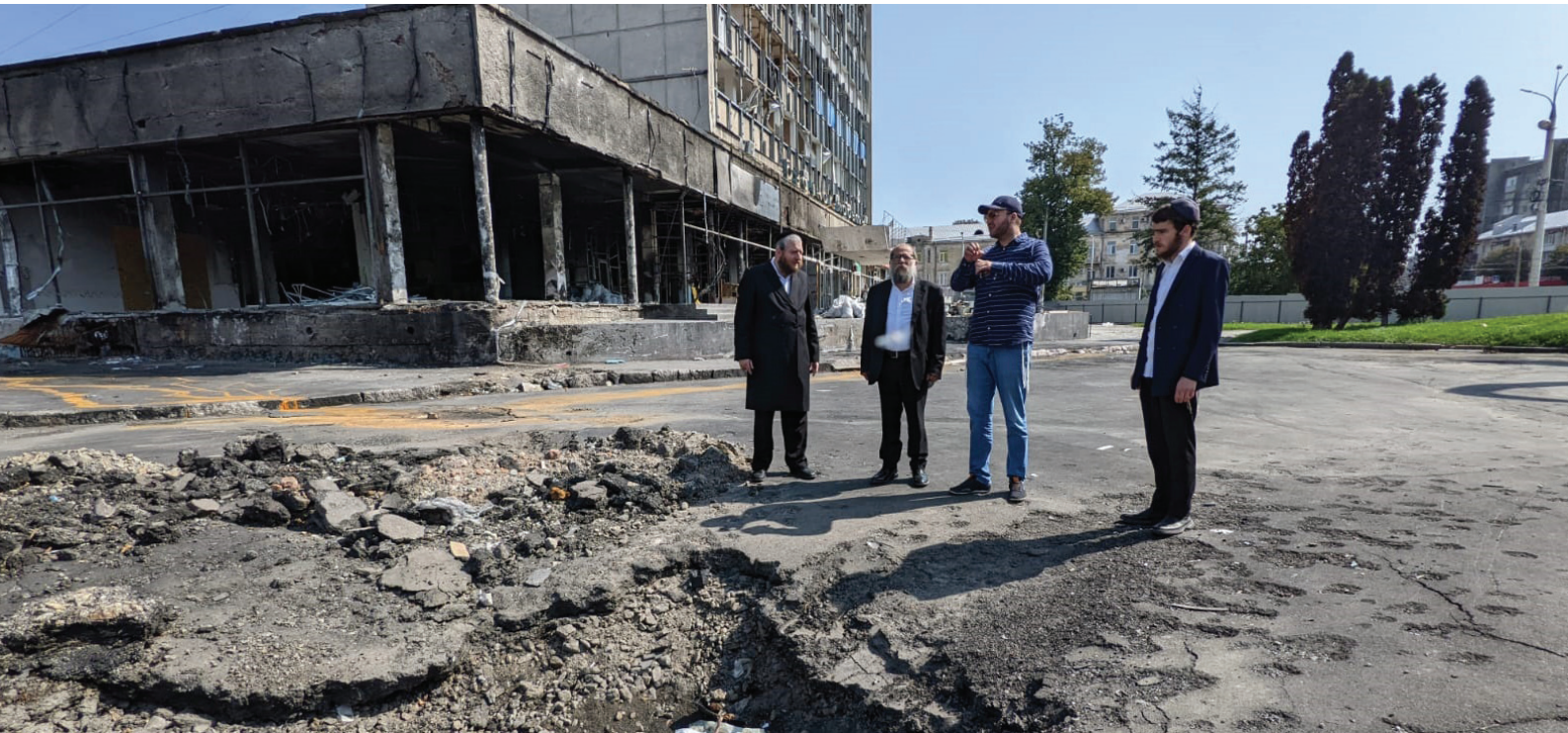
|| מאה ושלושים איש מצאו את מותם. במקום הנפילה של הטיל