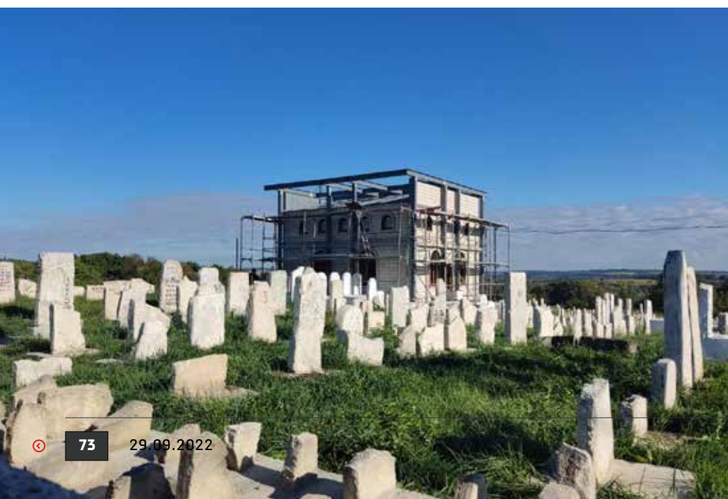
המקום שוקק החיים - כמעט שום כיום, ואזעקה נשמעת כמה פעמים ביום. מבנה הציון של הבעש"ט ז"ע במעזיבז (כעת בשיפוץ)

בתי כנסת ושבע חצרות אדמו"רים ובהם חסידות סטניסלב והדור השלישי של חסידות נדבורנה, שנקראת על שם העיירה השוכנת במחוז. עד מלחמת העולם היו היהודים כשישים אחוזים מאוכלוסיית העיר.