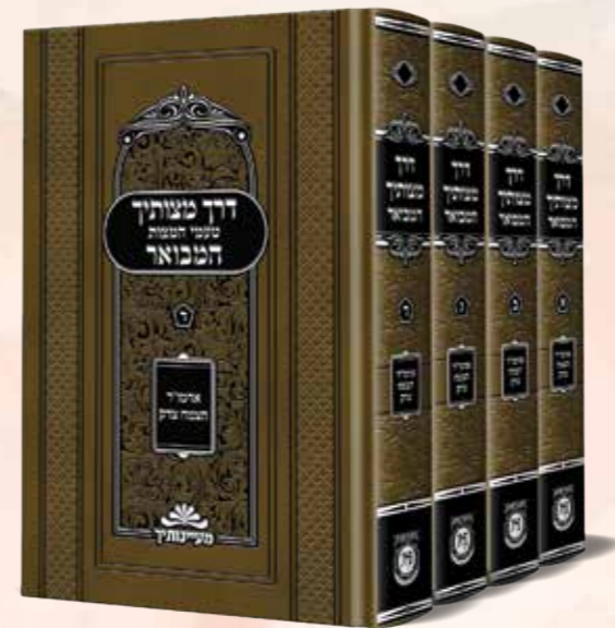
דרך מצותיך המבואר ד' כרכים

טעמי המצוות על פי החסידות לבעל ה"צמח צדק"