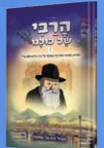
הרבי של כולנו - חלק ב' סיפורים בקומיקס מאת נתנאל אפשטיין