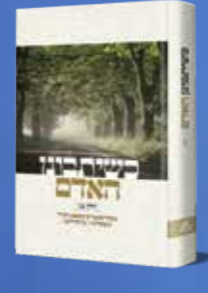
כשיתבונן האדם - מועדים מאמרים במשנת חב"ד מתוך גליונות מעיינותך