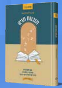
תובנות תניא 50 תובנות לחיים מספר התניא. מאת הרב אריק מלכיאלי