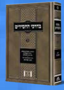
בדרכי החסידים - חלק ב' התועודות ה'חור' הגה"ח ר' יואל כהן