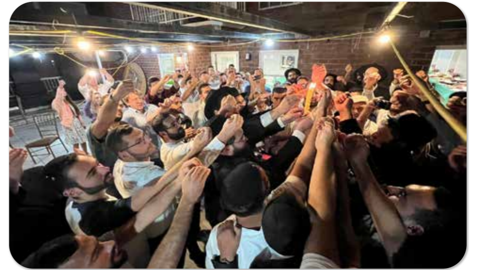
לקראת הנסיעה לרבי.

במהלך האירוע סיפר אחד הסטודנטים, שהוא עצמו כיום יו"ר אגודת הסטודנטים באוניברסיטת חיפה ובעבר זכה להשתתף במסע לרבי, את סיפורו המרגש: "במסע הקודם זכיתי להיות חלק מהקבוצה שנוסעת לרבי. עם זאת, באותה תקופה אבי שיחי' לא חש בטוב והיה עליו לעבור ניתוח רפואי מורכב. כשהגעתי לאוהל של הרבי, התפללתי על שני דברים: שאבא יבריא וירגיש טוב ושאוזה לקבל דולר של הרבי, שיהיה כלי מחזיק ברכה.