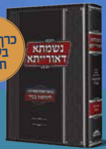
נשמתא דאורייתא ברכות ושבט ביאורי חסידות חב"ד לש"ס