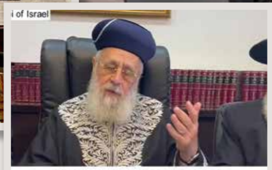
Which is intended for