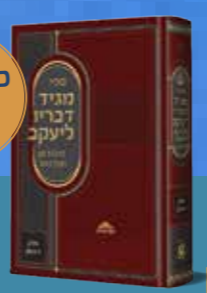
מגיד דבריו ליעקב המבואר כ"ק המגיד ממעזריטש