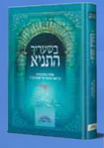
בשעריך התניא רבנים, סופרים והוגים פותחים צוהר, מזוויות שונות, לחידוש המהפכני של ספר התניא