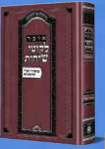
אוצר לקוטי שיחות ביאורי רש"י על התורה כ"ק אדמו"ר מליובאוויטש