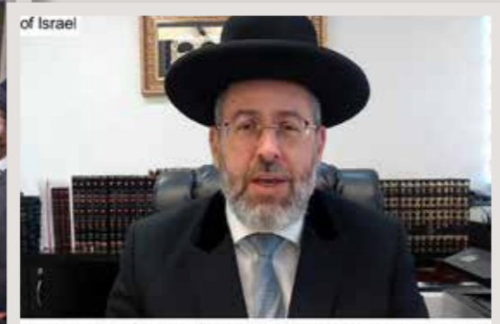
who are establishing a large spiritual center