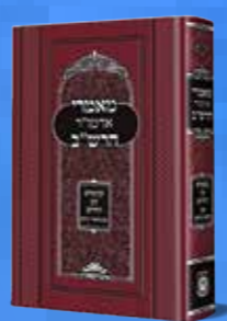
מאמרי אדמו"ר הרש"ב קונטרס עץ החיים עם ביאור חדש