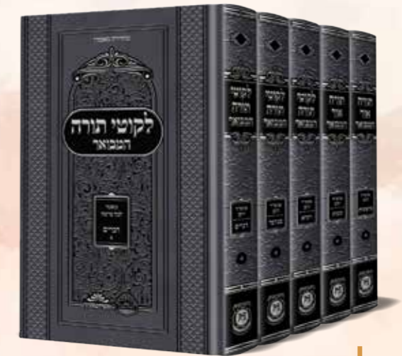
תורה אור ולקוטי תורה המבואר ה' כרכים

כ-100 מאמרים של בעל התניא לפרשות השבוע, מועדים ושיר השירים