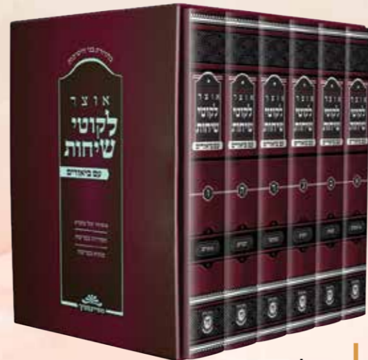
אוצר לקוטי שיחות עם ביאורים ו' כרכים

אוצר של 6 שיחות לכל פרשה וחג מתוך סדרת ט"ל כרכי לקוטי שיחות של כ"ק אדמו"ר מליובאוויטש בנוסף לקוטי שיחות לפי נושאים: לשיטתייהו, כלל ישראל, רש"י על התורה