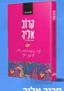
קרוב אליך 70 נשים כותבות מזווית אישית על פרקי ספר התניא