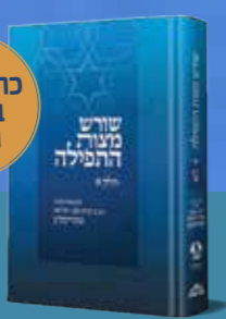
שורש מצוות התפילה לצמח צדק עם ביאור הרב עדין אבן ישראל (שטיינזלץ)