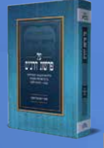
על פרשת דרכים - חלק ב' פירוש מעמיק בליקוטי אמרים. מאת הרב יחזקאל סופר