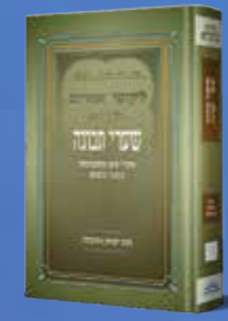
שערי תבונה שיערי עיון והתבוננות בליקוטי אמרים. מאת הרב יצחק גינזבורג