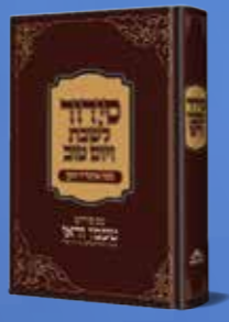
סידור טעמו וראו - שבת פנינים מחסידות חב"ד לתפילה