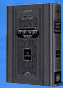
לקוטי תורה המבואר שיר השירים כ"ק אדמו"ר הזקן בעל התניא