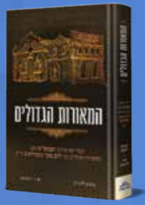
המאורות הגדולים - הבעש"ט והמגיד ממעזריטש בנימין ליפקין ויאיר וינשטוק