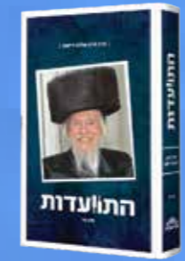
התועדות - הרב חיים שלום דייטש - חלק ב'