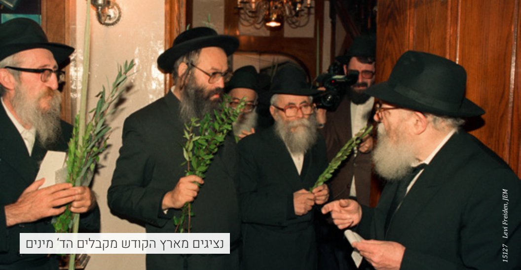
נציגים מארץ הקודש מקבלים 'הד' מינים