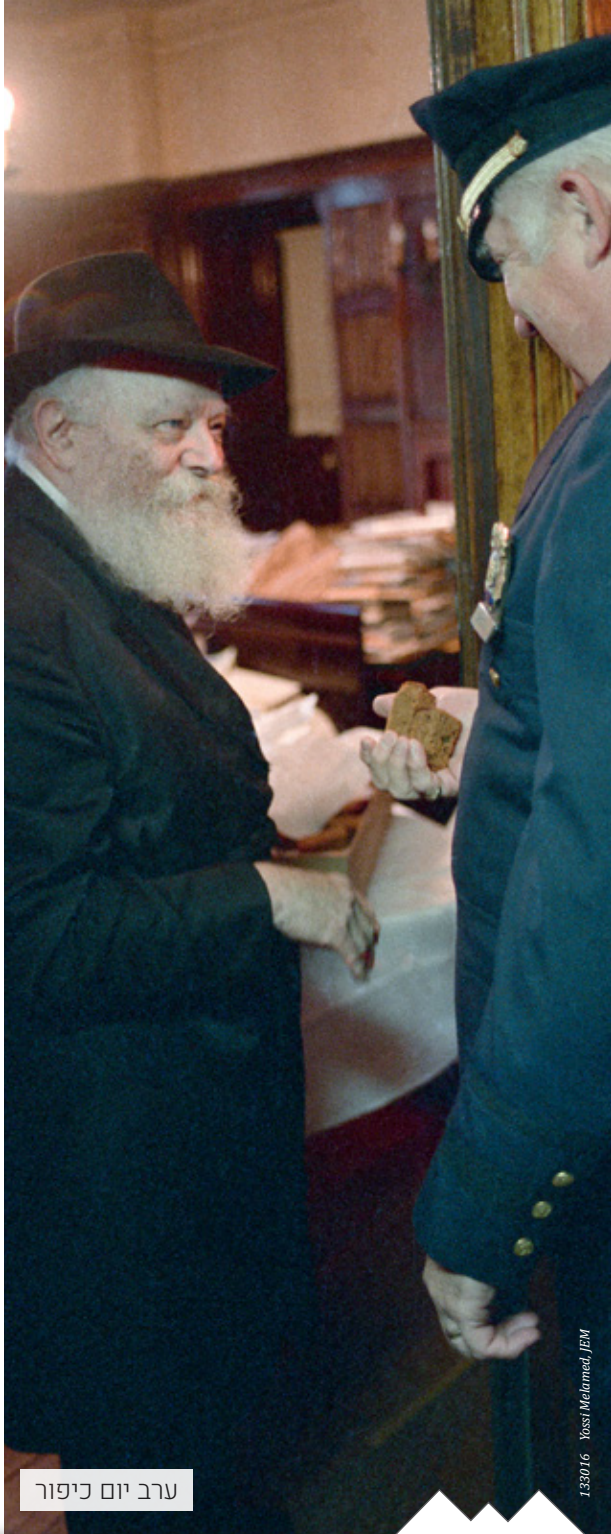
ערב יום כיפור

כ"ק אדמו"ר שליט"א יצא בקריאה לרבנים האמיתיים ביהדות שעליהם להוקיע את המעשה הזה ולזהיר אודות חומרתו הרבה. בהמשך אחד עבר כ"ק אדמו"ר שליט"א לדבר על ה"עשה טוב" בשבח שני המנהיגים הגדולים של מעצמות העל שקבעו ביניהם