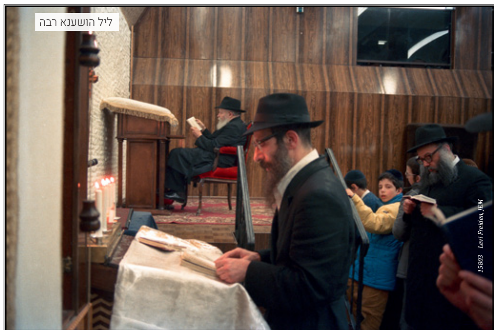
ליל הושענא רבה