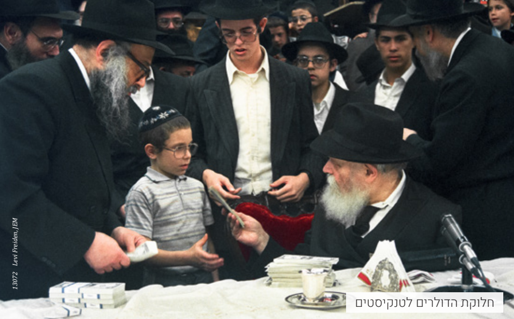
חלוקת הדולרים לטנקיסטים

‘לעשור’ השפעה כללית על כל השנה כולה ובפרט כשכבר עברו רובם של עשרת ימי התשובה ש’רובו ככולו’ כו’.