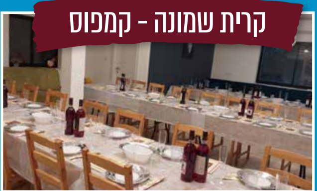
קרית שמונה - קמפוס