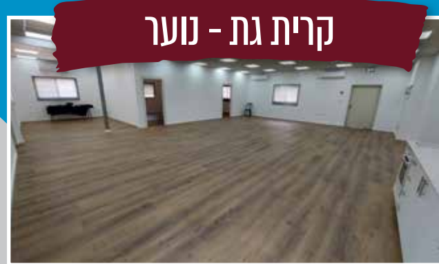
קרית גת - נוער