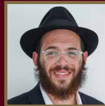
הרב מתתיהו אדרעי