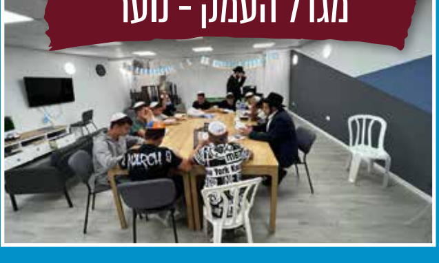
מגדל העמק - נוער