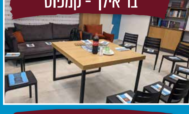
בר אילן - קמפוס