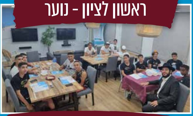
ראשון לציון - נוער