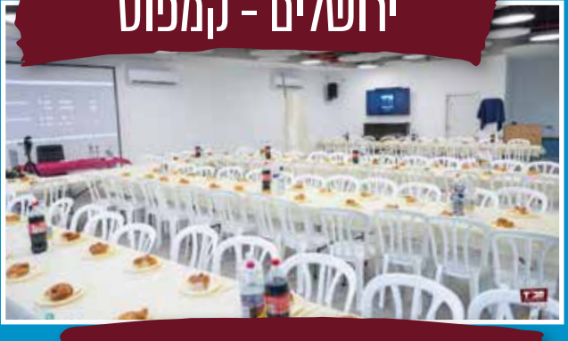
ירושלים - קמפוס