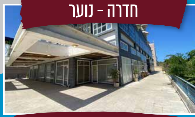
חדרה - נוער