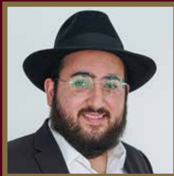
הרב מנחם מענדל מליכאלי מערב ראש"צ