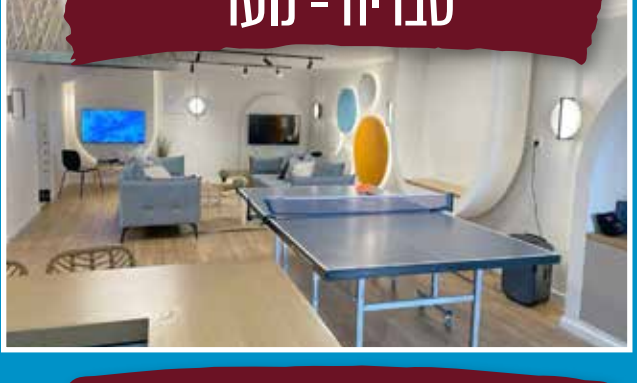
טבריה - נוער