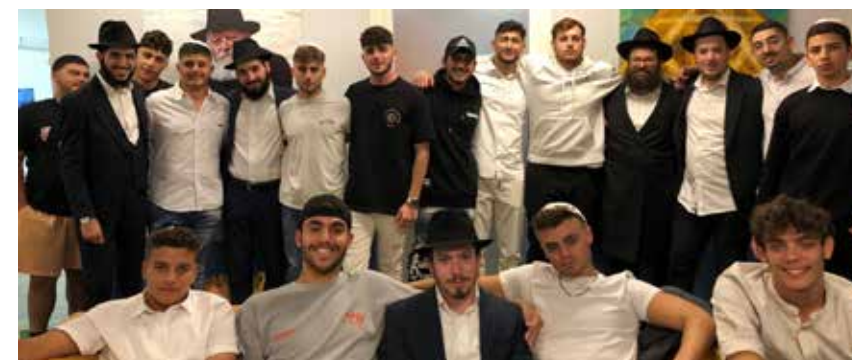
שבת הראשונה במתחם עם קבוצת נערים מחב"ד לנוער נתניה