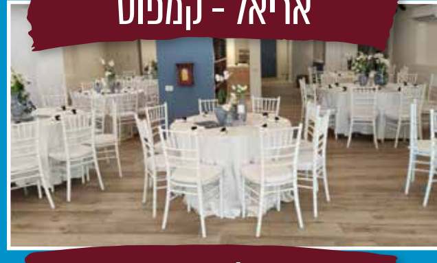
אריאל - קמפוס