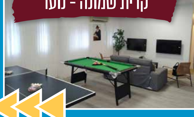
קרית שמונה - נוער