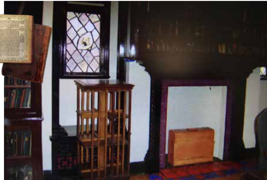
נכתב בגלות קזחסטן. ספרי הזהר של אבי הרבי מליובאוויטש הנמצאים בספרייה עם חידושים בקבלה בשולי הגיליון