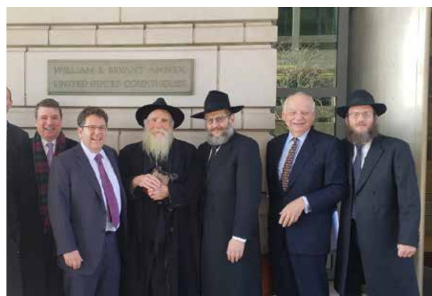
משימה שלא הסתיימה. חברי משלחת ההצלה ועורכי הדין אחרי מתן פסק הדין האמריקאי

יכול להתרחש לולא המלחמה שנישטת בחודשים האחרונים בין רוסיה לאוקראינה.