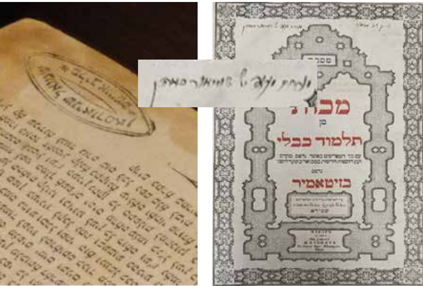
בידיים רעודות. שני ספרים שהועברו בחשאי לארה"ב: גמרא מסכת מכות דפוס ז'יטומיר עם חתימת ידו של כ"ק האדמו"ר היצמח צדק ז"ע, וספר השא את החותמת של בנו, כ"ק האדמו"ר מהר"ש מליובאוויטש ז"ע