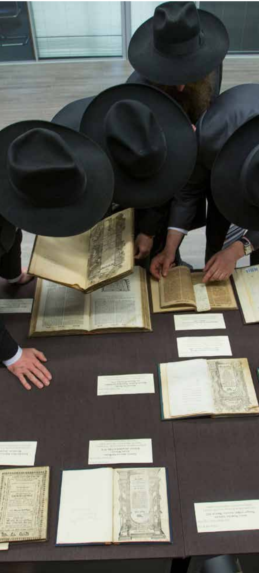
חצי הדרך. חסידי חב"ד במוסקבה מעללים בהתרגשות בספרי האדמו"רים שהועברו למוזיאון היהודי

הקרב החל, אך המערכה הגדולה עוד בחיתוליה. המהלך היצירתי לא היה