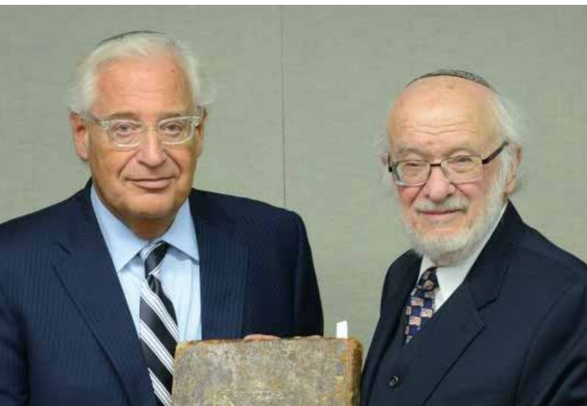
מאבק דיפלומטי. עורך הדין נתן (נאט) לזין מציג את אחד הספרים עם שגריר ארה"ב לשעבר דייוויד פרידמן

הקונגרס האמריקני. בין היתר הואיל לשלוח שבעה ספרים מ'אוסף שניאורסון', תמורת התחייבות ברורה כי הספרים יוחזרו לרוסיה על פי דרישה.