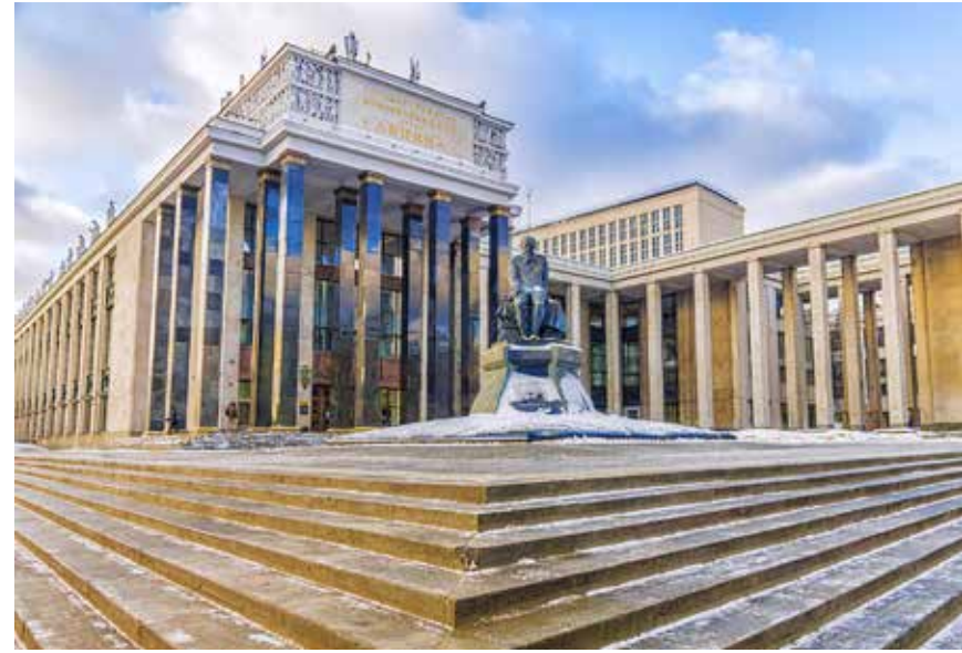
הלאמה מרושעת. ספריית לנין במוסקבה, בה הוחזקו הספרים במשך עשרות שנים