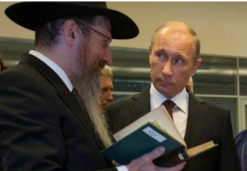
להשיב את האוסף המלאם. פוטין עם רבה של רוסיה הגר"ב לאזאר בטקס העברת הספרים במוסקבה