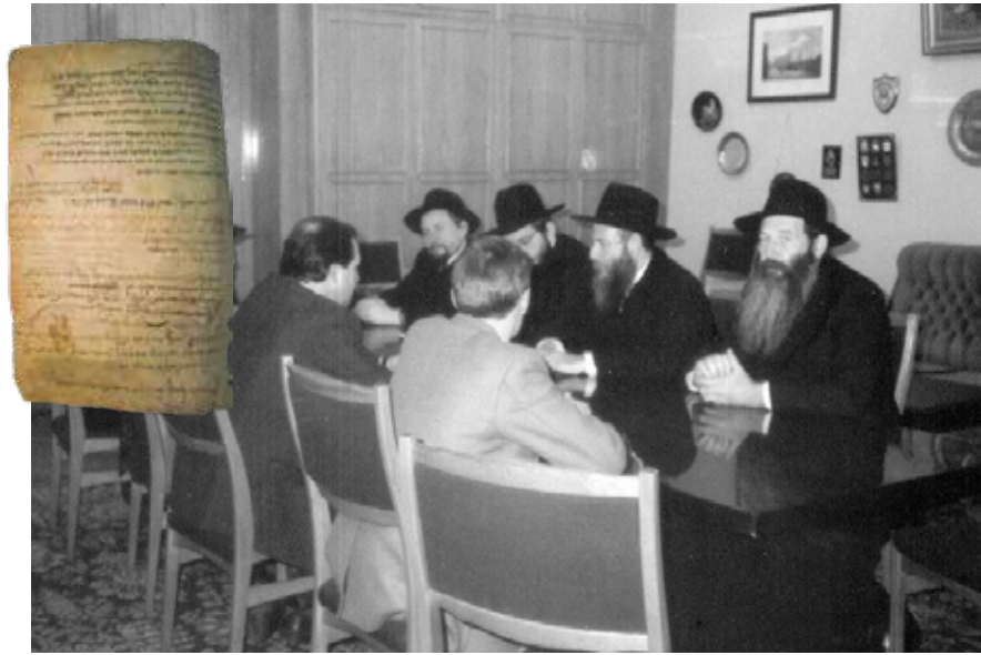
מזכרת מרגשת. דף מסידורו האישי של הבעש"ט עשומור בספריית ליובאוויטש בניו יורק