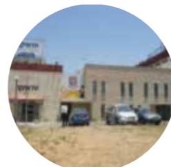
מתחם בית שזר