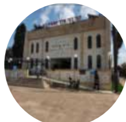
בית הכנסת בית מנחם