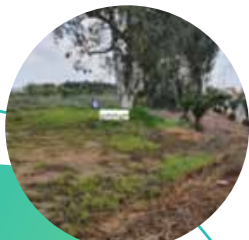
חלקה 126 בכניסה לכפר חב"ד