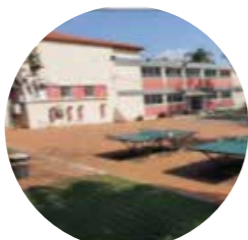
בית ספר יסודי בוגרות