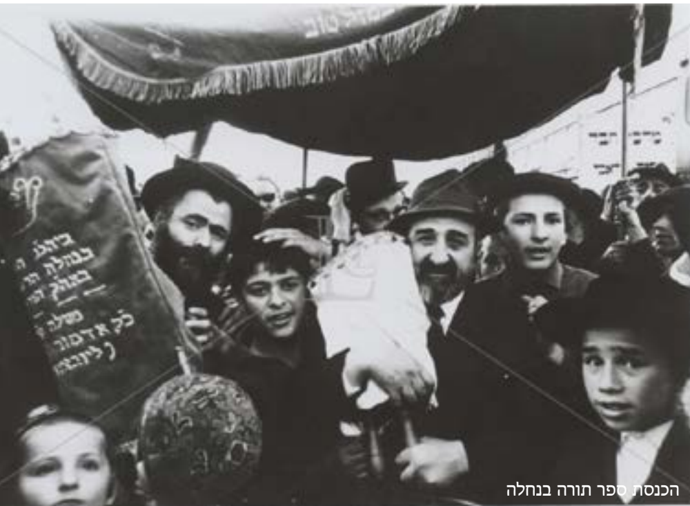
הכנסת ספר תורה בנחלה

הרבי בעיני רוחו ראה את הנולד, וכאשר עודד את ההתיישבות בקצה העיירה הדרומית, איש לא חלם על אימפריה של קהילה צומחת במהירות מטאורית, עם מוסדות משגשגים וארגוני חסד מפוארים, אבל הרבי ביקש, הפציר, הורה ועודד - להתיישב בנחלת הר חב"ד