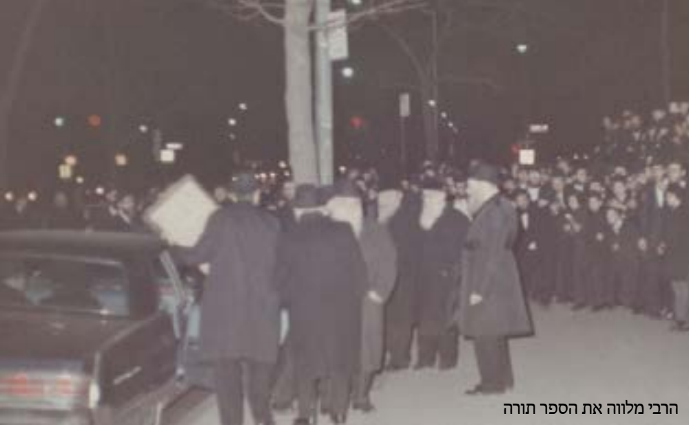
הרבי מלווה את הספר תורה

הרבי בעיני רוחו ראה את הנולד, וכאשר עודד את ההתיישבות בקצה העיירה הדרומית, איש לא חלם על אימפריה של קהילה צומחת במהירות מטאורית, עם מוסדות משגשגים וארגוני חסד מפוארים, אבל הרבי ביקש, הפציר, הורה ועודד - להתיישב בנחלת הר חב"ד