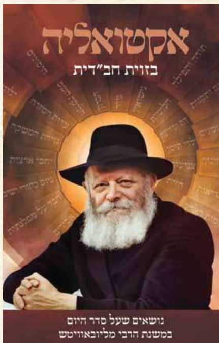
שער הספר החדש ש"ל ע"י מכון באהלי צדיקים בעריכת הרב שבתי ויינרטוב ה"ו

במדור מיוחד על חטיפת ילדי תימן, מובאת התייחסות לנושא כאוב זה: "ובמילא, כל זמן שלא עושים ככל האפשרי לתיקון המצב - הרי זה כמו שמשמשים לעשות אותו עוול ופשע, ומוכן, שבענייני זה לא יועיל לעשות תשובה - שכן, עניין התשובה הוא ביני לבין קונו, אבל, לכל לראש יש לתקן את העוול והפשע שנעשה לילדים והוריהם! ולאחרי כל זה, אם משהו מעלה על דעתו שהחרטו על המעשים שנעשו בעבר, ובוודאי שלא יחזרו עליהם חס ושלום, לא תקום פעמים צרה" - יש לו טעות מרה: לא זו בלבד שלא מתחרטים על זה, ולא מנסים לתקן את המצב וכי', אלא אדרבה - בעצם היום הזה חוזרים ונשנים הדברים בקשר לילדי טהרן, ובצורה חריפה יותר, ואין פוצה פה ומצפצף. וחוב קדוש על כל מי שיש ביכולתו לעשות כל התלוי