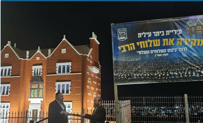
הוקרה לשלוחים לרגל הכניסה, ראש העיר עם הרב משה כהנה על רקע בנין 770 בכיכר השלוחים