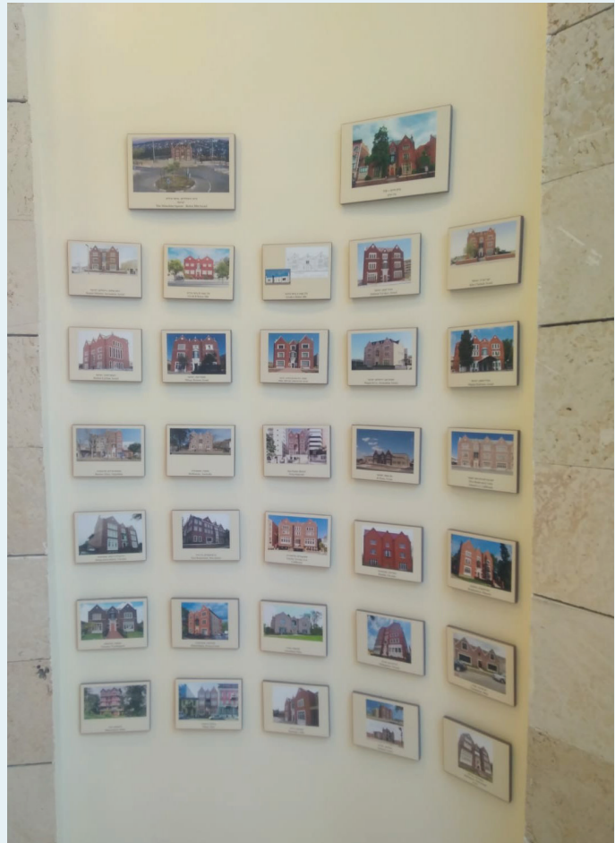
בחיכל מנחם הוקם קיר מיוחד המציג את מגוון המבנים בדמות 770 שהוקמו ברחבי תבל. זכתה עירנו שיש כיום 3 מבנים בדוגמת 770