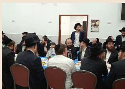
התוועדות בבית הכנסת חב"ד רח' אבא שאול