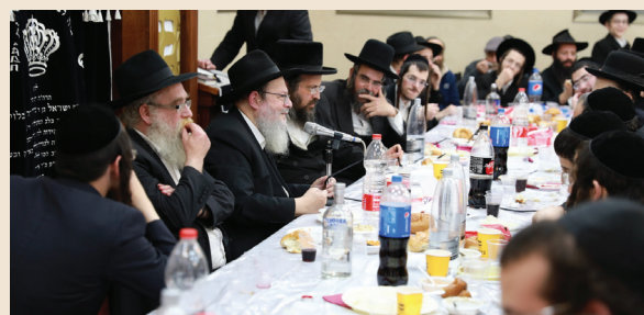
התוועדות במעייני ישראל