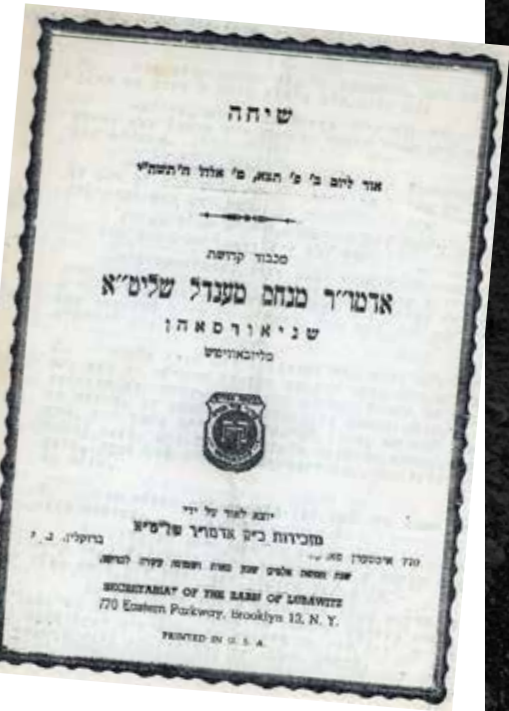
הקונטרס שהגיה הרבי שלוש פעמים, עם השיחה שנאמרה בהתוועדות המיוחדת והנדירה שהתקיימה לרגל צאתו של ר' זושא לשליחות. בראש השיחה נכתב: "בקשר לנסיעת ה'ת"ו. ש"פ. לאה"ק ת"ו"