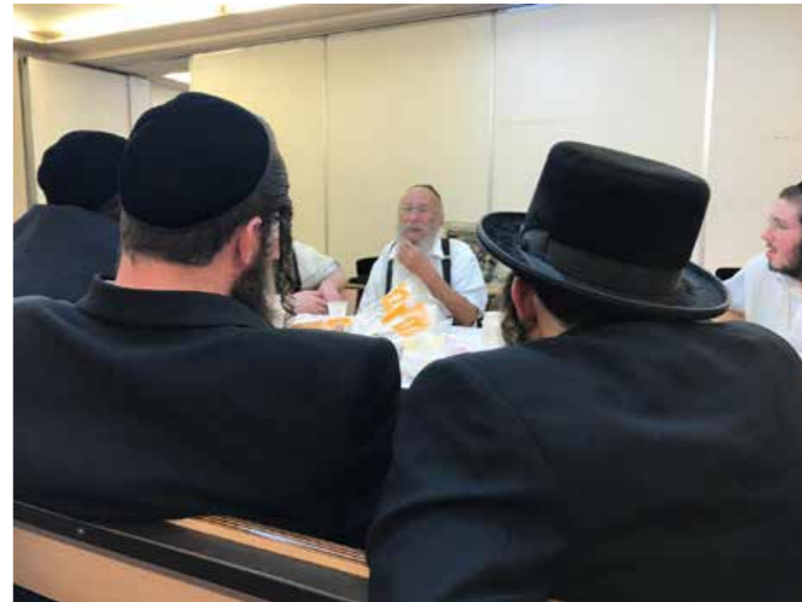
משפיע ומחנך. ר' זושא מתועד

צוות אוקראינה צוות אמריקה הלטינית צוות אירופה צוות מזרח