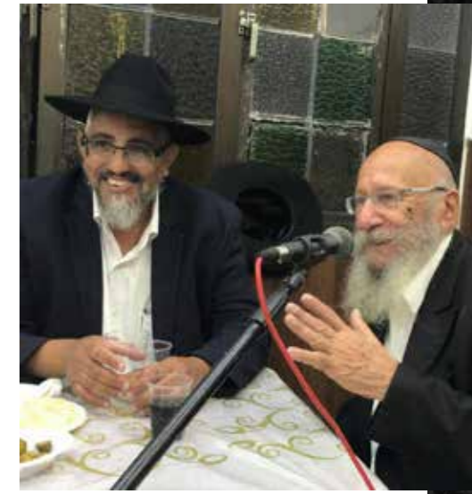
מתועד ב-770 בכפר חב"ד