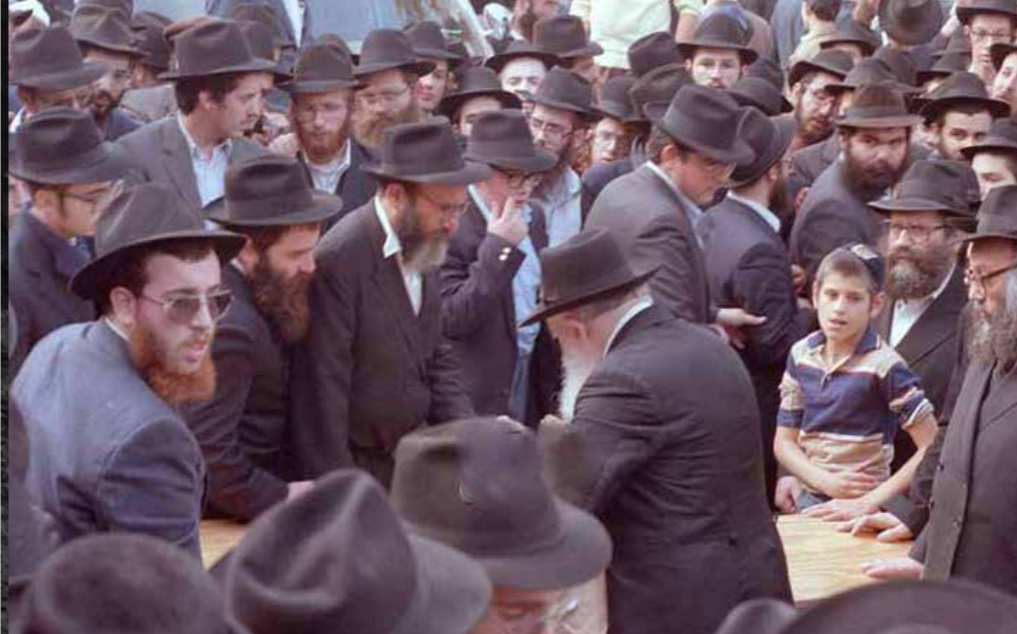
ה' תשרי תשמ"ה. ר' זושא מקבל מידו הק' של הרבי מטבע ביציאה מ"770 JEM | 213431