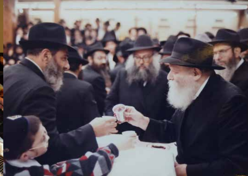
לחיים ולברכה. עובר במעמד 'כוס של ברכה'