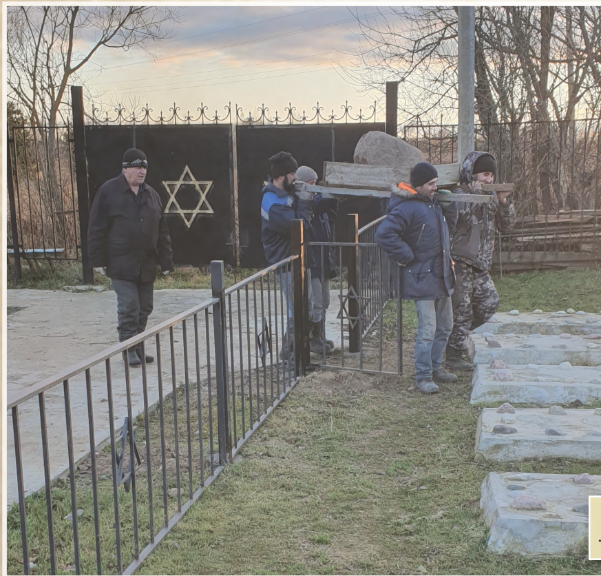
הפועלים הנכרים במהלך העברת המצבות מבתי התושבים בחזרה למקומם.