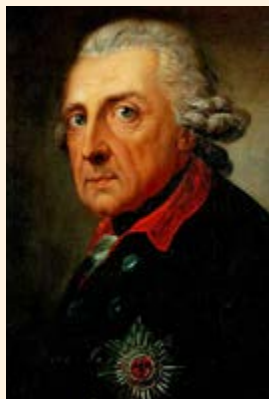
פרידריך השני מלך פרוסיה

וכמו כן יש להבין ההפרש שבין הספרי מוסר והחידוש שחדשו תלמידי הבעש"ט זללה"ה ותלמידי תלמידיו זכר כולם לחיי העולם הבא, כי בכל הספרים ספרי מוסר מבואר גנות המדות רעות ואיך שיש להרחיק מזה, למשל איך שיש לגנות הכבוד