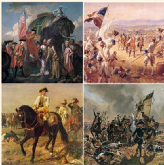
ממראות קרבות מלחמת שבע השנים בציורים בני התקופה

והענין הוציא מזה הרב הק' ר"א ז"ל בעבודת ה' שהיא מלחמת היצר, דזה לעומת זה עשה האלקים, וכמו שיש מדות בקדושה [הנחלקים דרך כלל לג' קוין ימין ושמאל ואמצע] שהן אהבה ויראה ורחמנות או