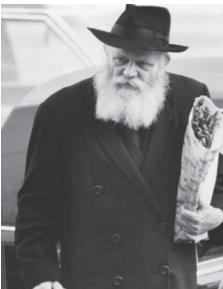
תמונה נדירה בה נראה הרבי צועד אל פתח בית חיינו ובידו הדסים וערבות

... על-פי הרגילות שהיתה אצל כו"כ חסידים, שהיו מחשיבים (מסבירים ומפרסמים) שיום הולדתם הוא – הפעם הראשונה שבאו לליובאוויטש אל הרבי, אצל כל רבי בזמן נשיאותו, ועד"ז בזמן נשיאותו של נשיא דורנו – אלה שבאו ל"ליובאוויטש שבליובאוויטש" של נשיא דורנו כ"ק מו"ח אדמו"ר... כ"ז אלול תנש"א