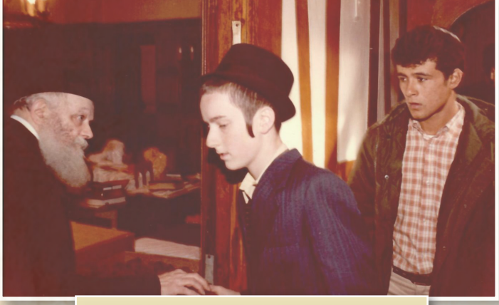
ערב יום הכיפורים תשמ"ב