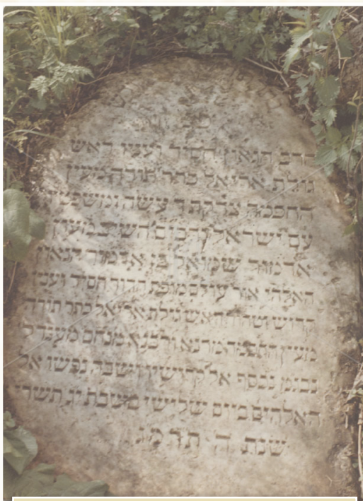
מצבת אדמו"ר מהר"ש כפי שנמצאה לפני שנים רבות (שנות ה'כ?'), מוטלת על השיחים.