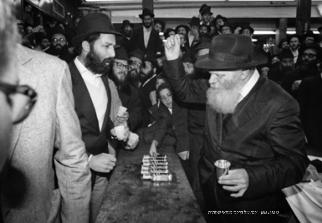
תמונה: 'כוס של ברכה' מוצאי שמה"ת JEM 125812

מידי פעם הורה אד"ש להגביר השירה. באמצע החלוקה צוה אד"ש לשיר "האדרת והאמונה", ועודד בידו הק' ע"י שהניפה בעוז להגביר השירה.