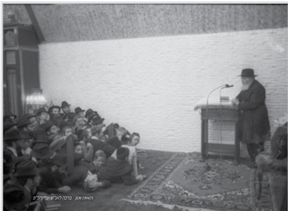
ברכה לאב"ש עירוה"כ פ' JEM 199471