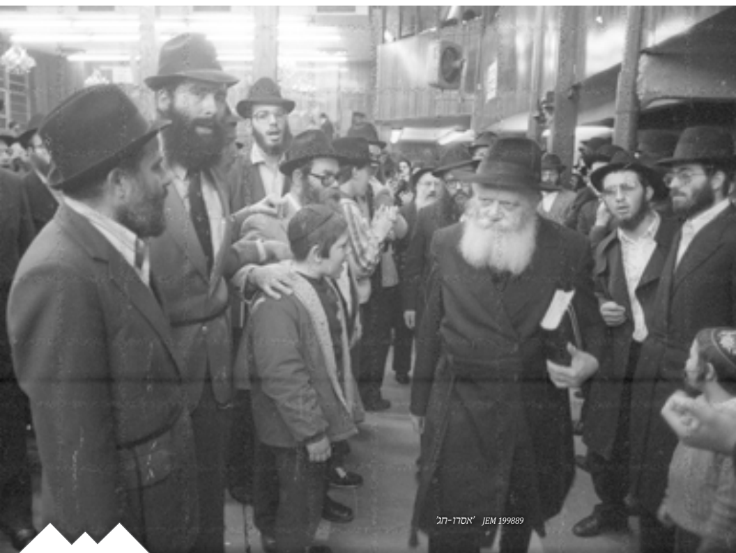
אסרו-חג' JEM 199889

נסע למקוה, ובחזרתו מהמקוה אמר לר"ז יפה שגם לאחר שמח"ת צריך להיות שמח, ועשה לו אד"ש בב' ידיו לסימן שישיר. וכן אמר לאדם אחר (האגרופון) החמצת אתמול (היינו,