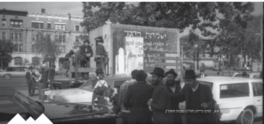
סוכה ניידת הו"מ סוכות תשמ"ב JEM 199440

לאחר התפילה נכנס אד"ש לסוכתו. כשיצא ממנה נכנס לסוכת האורחים -