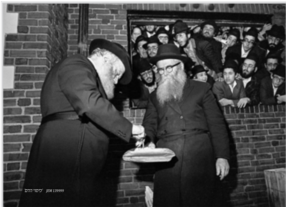
EM 139999 'כיסוי הדם'