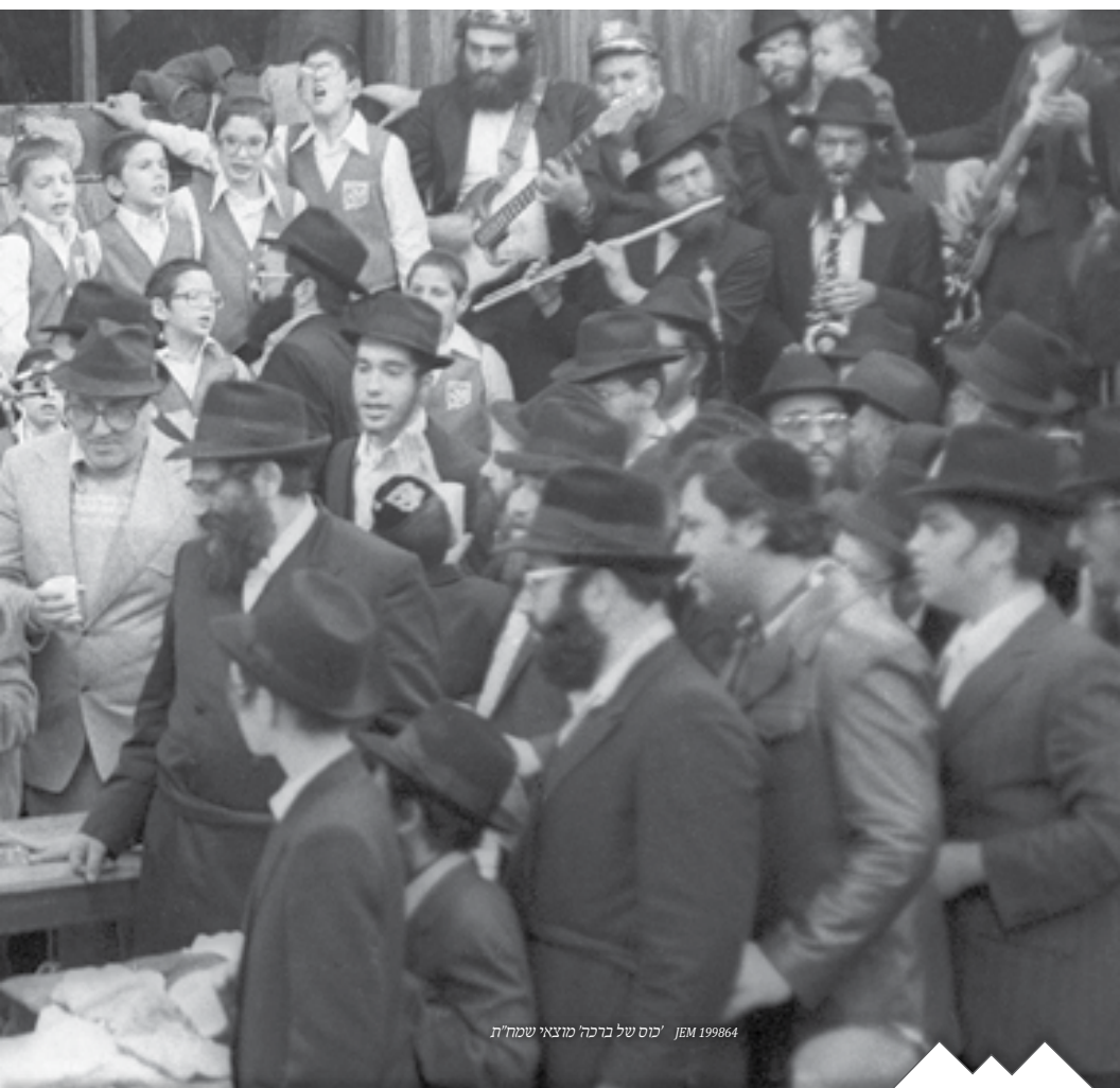
JEM 199864 'כוס של ברכה' מוצאי שמח"ת

שיחה ג': ביאר הענין ד"ויעקב הלך לדרכו", וכן עורר על שיעורי חת"ת, ועורר על ישום כל ההחלטות הטובות שכאו"א קיבל על עצמו במשך חודש תשרי. בהמשך השיחה אמר שנהוג לערוך לאחר שמח"ת "כינוס תורה", וכן נהוג להשתתף בזה, שלכן אמר אד"ש שגם הוא ישתתף בזה בב' אופנים. א. נתינת החלה והיין והמים מההתועדות.