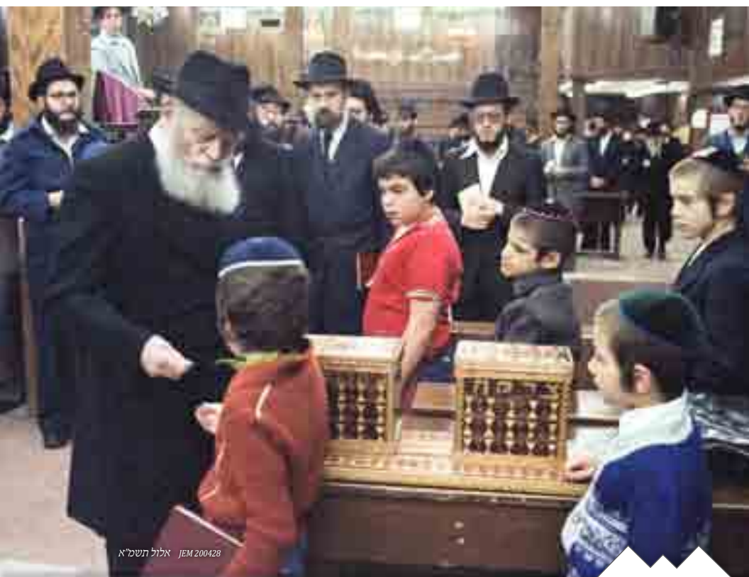
אלול תשמ"א JEM 200428

ובהתקלו בילדים שעדיין לא הגיעו לגיל בר או בת מצוה, או אף בתינוקות הנישאים בידי הוריהם, הבל שאין בהם חטא - נותן הרבי גם בידיהם מטבעות של צדקה, ממנה אותם לשליחי מצוה ועוקב בעיניו הקדושות אחרי שלשולם את המטבעות בקופות הצדקה. הילדים והטף ממלאים שליחותם זו בלהט נעורים ובהתלהבות קודש. כך משריש הרבי גם בלב הפעוטות נוהג ומצוה רמה זו של הפרשת צדקה לפני התפלה. וחזקה עליהם שגם בהתבגרותם לא יסורו מכך. וכך גם מלמד אותנו הרבי