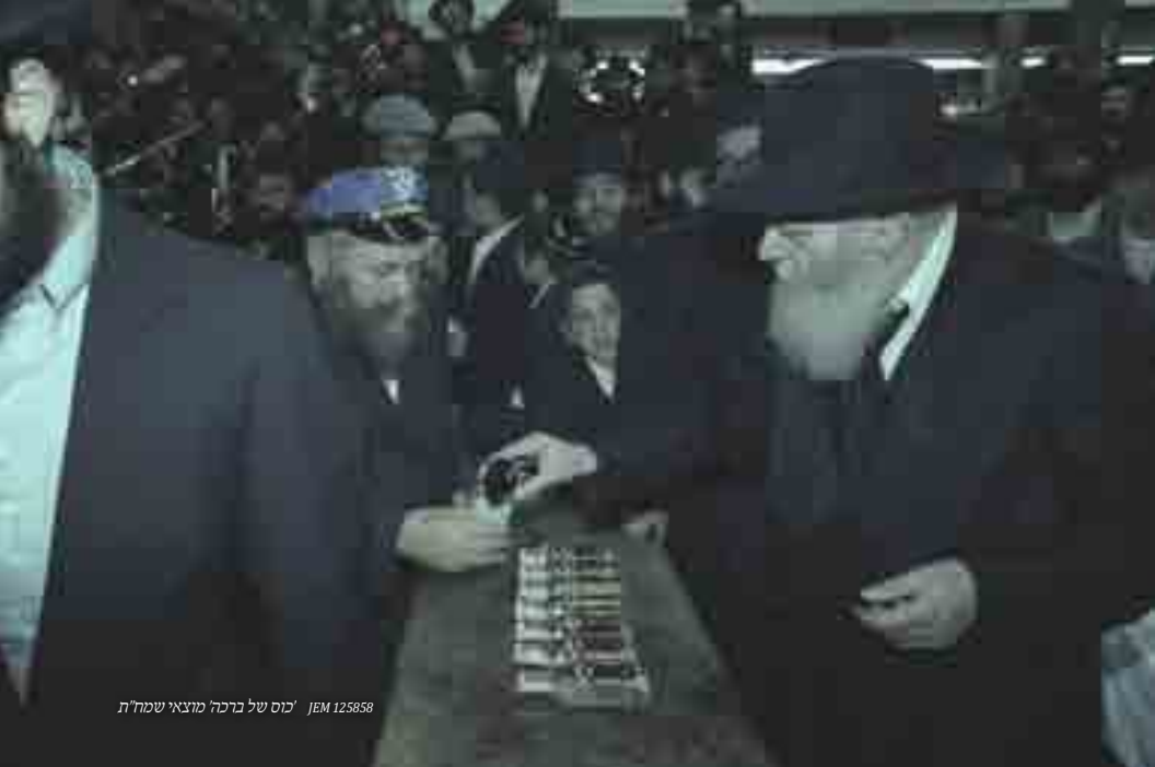
JEM 125858 'כוס של ברכה מוצאי שמח'ת

בשאר ה"אתה הראת" אמר אד"ש רק את הפסוק הראשון והאחרון. לאחר סיום ה"אתה הראת" השלישי הוסיף ואמר את הפסוק "והי' זרעך גו" ג' פעמים.