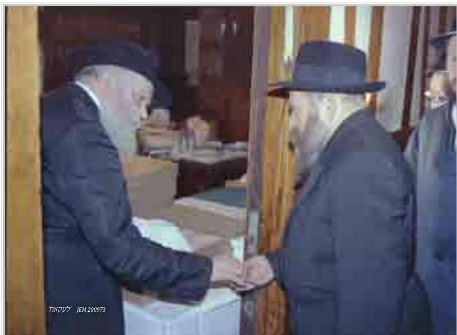
'לעקאה' JEM 200973