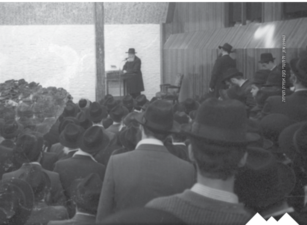
ה' תשרי תשנ"א, אמירת השמחה