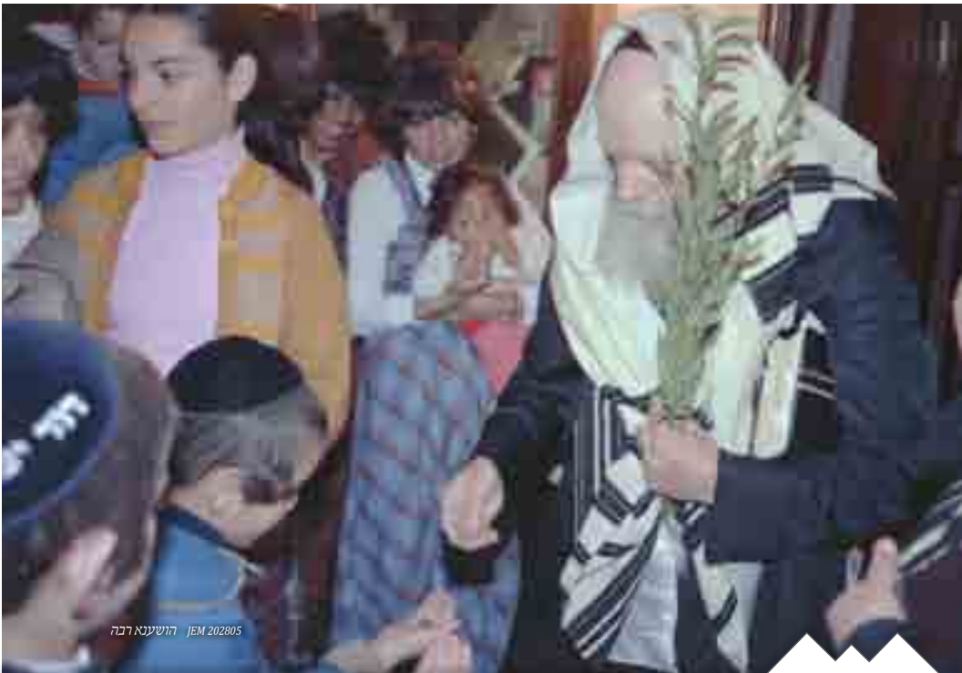
הושענא רבה JEM 202805

וכללות השמחה מודגש בשיעור היומי "וללוי אמר" - שענינו של לוי הי' לשורר בביהמ"ק, ושמחה זו פועלת בכל העולמות והיא הכנה לשמחת שמע"צ ושמח"ת. בהמשך השיחה עורר אד"ש אודות אחדות עם ישראל ע"י ס"ת.