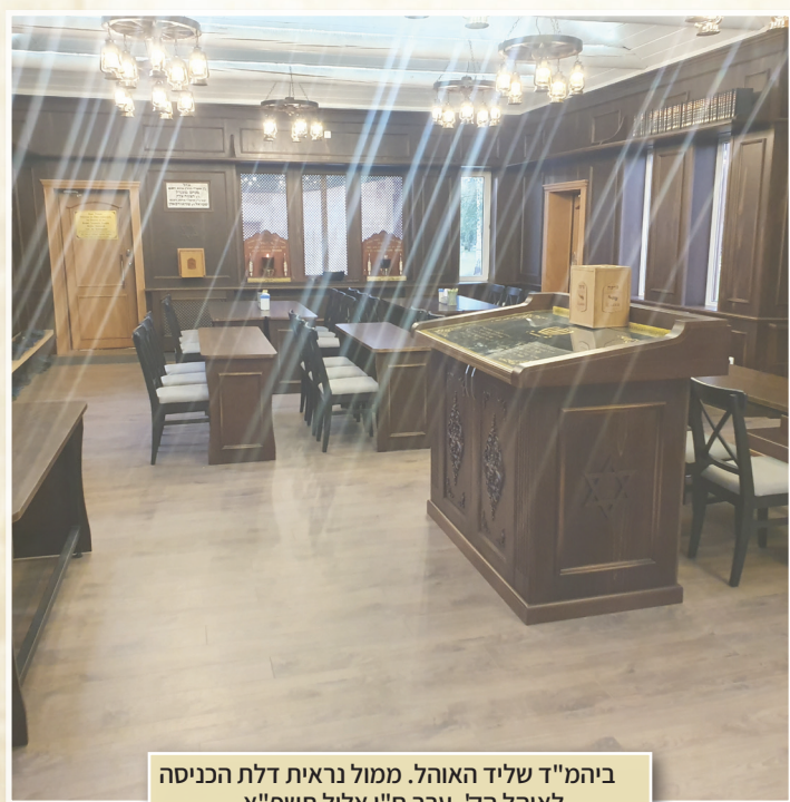
ביהמ"ד שליך האוהל. ממול נראית דלת הכניסה לאוהל הק. ערב ח"י אלול תשפ"א.

בשעה ששית, הואיל הוד כ"ק אאמו"ר הרה"ק לאמר המאמר זה היום תחילת מעשיך וזכרון ליום ראשון שעה ורבע בערך, ותוכנו: עליות דגן עדן והביטול בין מדריגה למדריגה. רבע שעה האחרונה דיבר הוד כ"ק אאמו"ר הרה"ק בעייפות גדולה, וכשיצא הוד כ"ק אאמו"ר הרה"ק מהאולם, כרגע יצא כל הקהל במחול. .